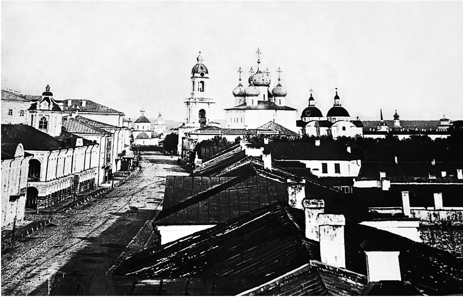
Миллионная улица в Твери. 1860 год. Тверь была прототипом губернского города в «Бесах»

внимательным. Единственная настоящая лакуна находится между восьмой и девятой главами: в этом месте, в самом центре романа, должна находиться глава «У Тихона», которую по цензурным соображениям отказался публиковать издатель «Русского вестника» Катков. В современных изданиях изъятая глава публикуется в виде приложения, в ней Николай Ставрогин исповедуется и фактически объясняет свое будущее самоубийство.