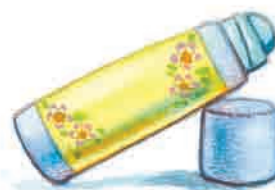
СРЕДСТВО ОТ КОМАРОВ