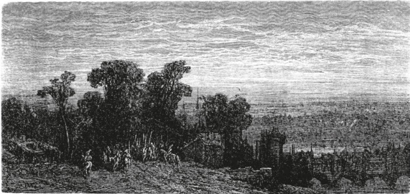
Лондон в Средние века

Благодаря частым и продолжительным поездкам в Лондон нам удалось погрузиться в жизнь столицы Соединенного Королевства. Снова и снова изучая многоликий и переменчивый ее характер, мы постигли его противоречивость и проникли в его тайны. И, несмотря на это, сомнения и нерешительность овладели нами, когда, взяв в руки перо, дабы написать первую страницу книги под названием «Лондон», мы осознали величие и сложность задачи. Удручающе очевидной стала невозможность охватить всё и вся, а вслед за ней родилась уверенность в том,