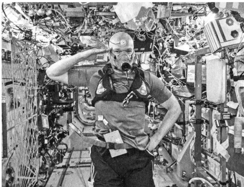
Астронавт, геофизик и вулканолог Александр Герст на борту МКС во время проведения эксперимента по постоянному измерению температуры тела

случае, пока. Однако этой доступности все больше угрожает сам человек. Нерациональное потребление ресурсов, загрязнение окружающей среды и усугубляемое людьми изменение климата стремительно сокращают жизненное пространство человечества. Всего лишь один пример — расширение площади пустынь, которое разрушает условия жизни миллионов людей в Африке, Азии и Австралии. Важнейшей основой для противодействия такому развитию событий становится более полное понимание окружающего мира и независимый взгляд на самих себя — как бы со стороны. Это возможно не только благодаря космическим исследованиям, но и благодаря изучению отдаленных регионов нашей планеты — будь то полярные области, высокие горы или глубины морей. Будучи специалистом по физиологии чело-