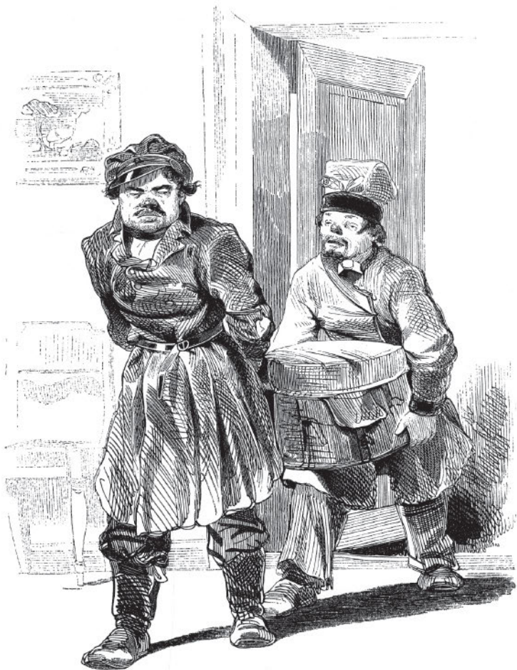
Чемодан внесли кучер Селифан... и лакей Петрушка...