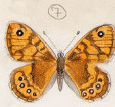
Lasiommata megera ♀