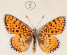
Melitaea didyma ♂