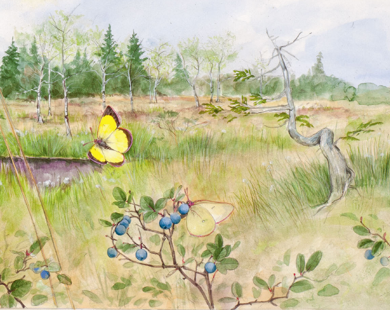
(14) Parakeete ( Vicinium nigropurpureum )