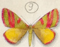
⑨ Adonis-Pechsteinfalter - Zerynthia agestor