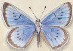
③ Großer Ackerbläuling - Acraea taharia