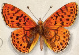
⑤ Adonis-Pechsteinfalter - Zerynthia agestor