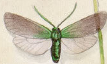
⑪ Adonis-Pechsteinfalter - Zerynthia agestor