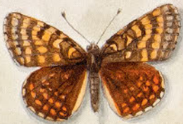
⑦ Silberfalter - Metis alba