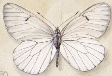
① Sommerfalter - Apollonia croceipes