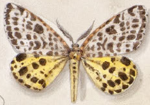
② Saualbfl. - Colias palaona