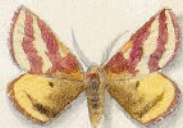
⑩ Silberfalter - Metis alba