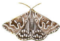
Совка клеверная серая

Издали открытая поверхность без деревьев кажется сухой и бесплодной. В жаркий летний день воздух дрожит, и пучки травы на песчаной почве как будто отливают серебром. Висит пряный аромат сосен и можжевельника. Вот летит большая светло-желтая бабочка. Плавный полет объясняет название ее семейства: это парусник подалирий ( Iphiclides podalirius ), одна из самых крупных бабочек Центральной Европы с размахом крыльев до 8 см. Когда подалирий ненадолго присаживается на головку букашника горного, становятся видны идущие сверху вниз черные полоски на бледно-желтом фоне крыла и характерные хвостики на задних крыльях.