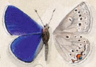
⑥ Saualbfl. - Colias palaona