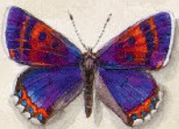
④ Blauschwarze Fäufalter - Lycaena helle