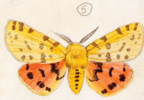
Rhyacionia purpurata ♂

Handwritten notes on the left side of the page, including a circled number '9' and some illegible text.