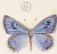
Acodina airon ♂