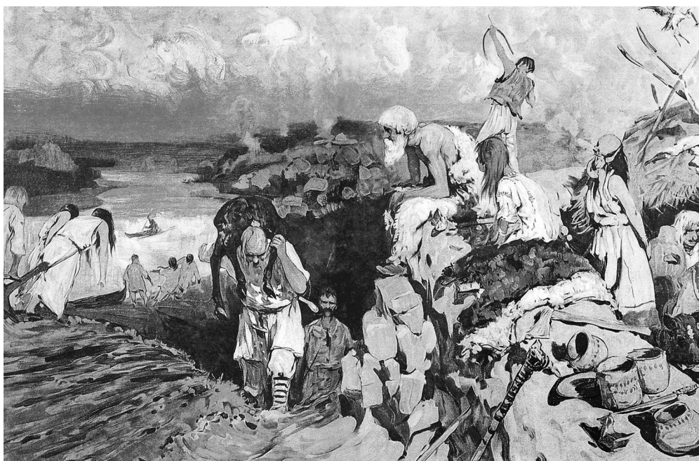
С.В. Иванов. Сцена из жизни восточных славян

них был Перун, бог грома и молнии; — поклонялись также солнцу под разными именами (Дажбога, Волоса), огню, ветру. Верили в загробную жизнь, думали, что души умерших могут есть, пить, и потому считали обязанностью угощать их. Общественного богослужения, храмов, жрецов у них не было; старшины или родоначальники были и жрецами, приносили жертвы.