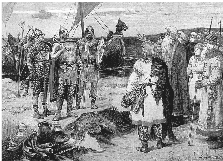
В.М. Васнецов. Варяги

В то время, когда южные славянские племена платили дань козарам, северные не могли защищаться от норманнов, жителей Швеции, Норвегии и Дании, которых славяне называли варягами и русью. Эти варяги покорили себе славян северных, живших в нынешних Новгородской и Псковской губерниях, покорили также соседние финские племена. Через несколько времени племена эти, как славянские, так и финские, собрались вместе и выгнали варягов, но когда после этого стали управляться сами, то никак не могли мирно улаживаться; опять каждый род стал жить отдельно и силою разделяваться с другими родами. Тогда племена собрались и сказали: «Поищем себе князя, который бы владел нами и судил по праву». Порешивши так, послали они за море к варягам-руси сказать им: «Земля наша велика и обильна, а порядка в ней нет: приходите княжить и владеть нами». На этот зов в 862 году собрались три князя варяго-русских, три брата — Рюрик, Синеус и Трувор и пришли с родными своими. Рюрик утвердился в Новгороде, у славян, живших по Ильменю; Синеус — среди финского племени на Белоозере; Трувор — у славян, живших в нынешней Псковской губернии, в городе Изборске. Скоро Синеус и Трувор умерли, и Рюрик стал княжить один;