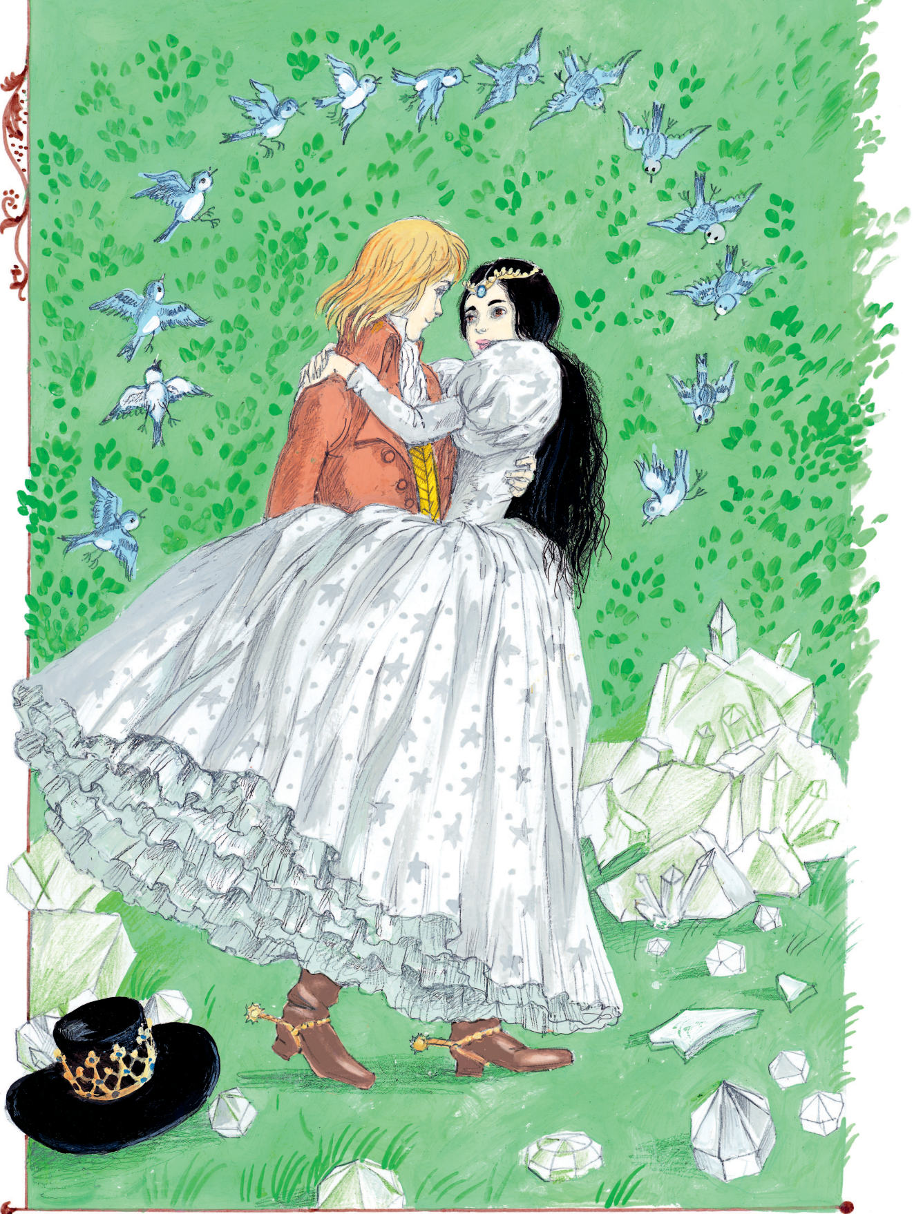
Рисунки А. Власовой