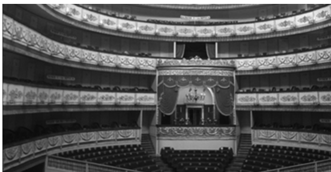
Царская ложа в Александринском театре

В царской ложе, у самого бортика, сидят четверо: царь Александр II, по бокам от него княгиня Юрьевская и Великий князь Константин Николаевич, за последним — цесаревич Александр Александрович. Ладони сдвигают все четверо, но по-настоящему хлопает только император, остальные делают это беззвучно. В глубине ложи стоит, сверкая эполетами, флигель-адъютант.