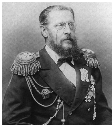
Великий князь Константин Николаевич