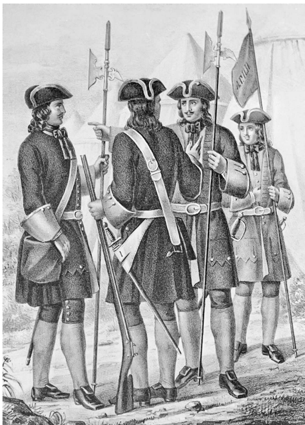
Солдаты лейб-гвардии Преображенского полка. Литография. XIX в.

Несколько короче длился другой примечательный феномен, так называемый «женский век» русского самодержавия, с небольшими перерывами продолжавшийся семь десятилетий. Само женское правление не было для Руси чем-то невиданным. Полулегендарная Ольга Киевская или великая княгиня московская Софья Витовтовна, предположим, жили очень давно, но сохранилась память о регентше Елене Глинской, а воспомина-