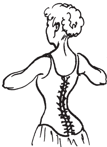
Рис. 2 Поясничный корсет

Наибольшее сокращение мышцы брюшного пресса совершают, когда вы максимально сгибаетесь в пояснице. Однако это вызывает тяжелейший стресс для дисков, связок и суставов позвоночника.