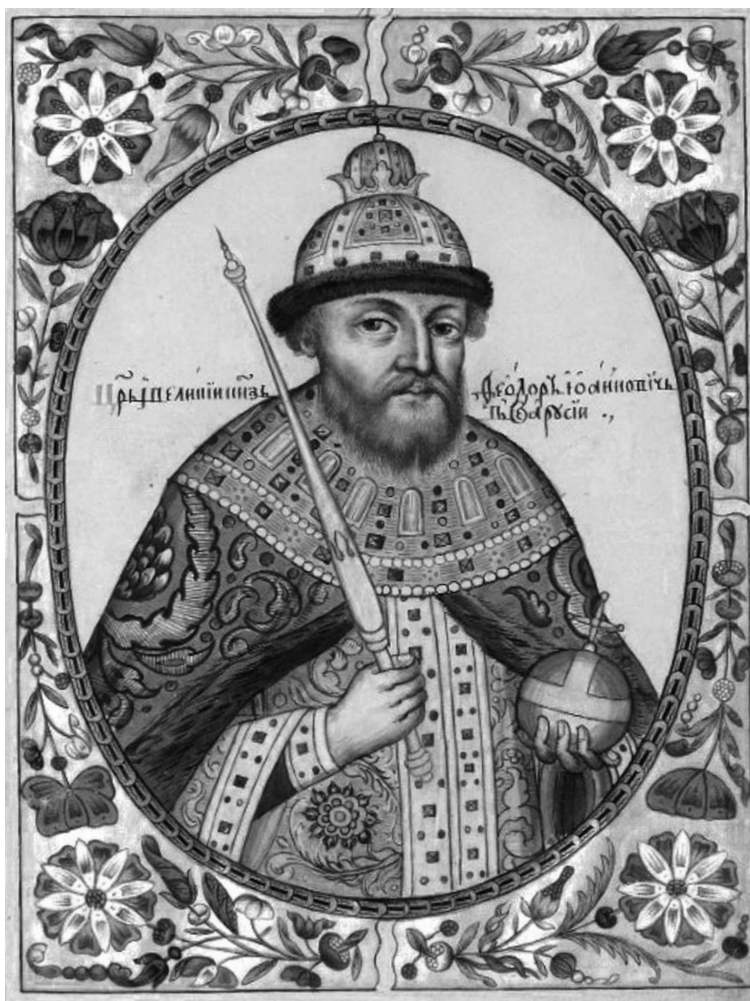
Федор Иоаннович, портрет из Царского титулярника, лицевая рукопись. 1673 г.

сохранностью царских икон, посуды, одежды царя, а также защищал постель правителя от колдовства). Постельничий был важной персоной и имел в распоряжении целый штат людей, следящих за удобством в царских покоях и его гардеробе. Как пишет Котошихин, «ведает его царскую постелью