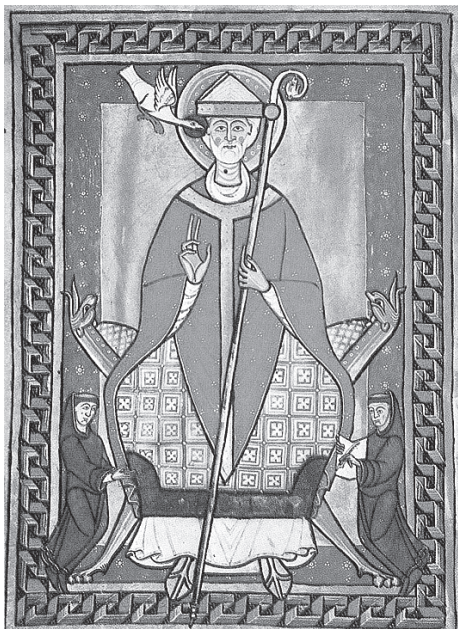
Папа Григорий VII. Миниатюра. XIV в.

ли папству. Григорий VII Неистовый отлучал от церкви многих. В 1077 году, например, германского императора Генриха IV, которому пришлось торжественно покаяться. А вот Гвискар кланяться не поехал. Он вообще не обратил на отлучение особого внимания.