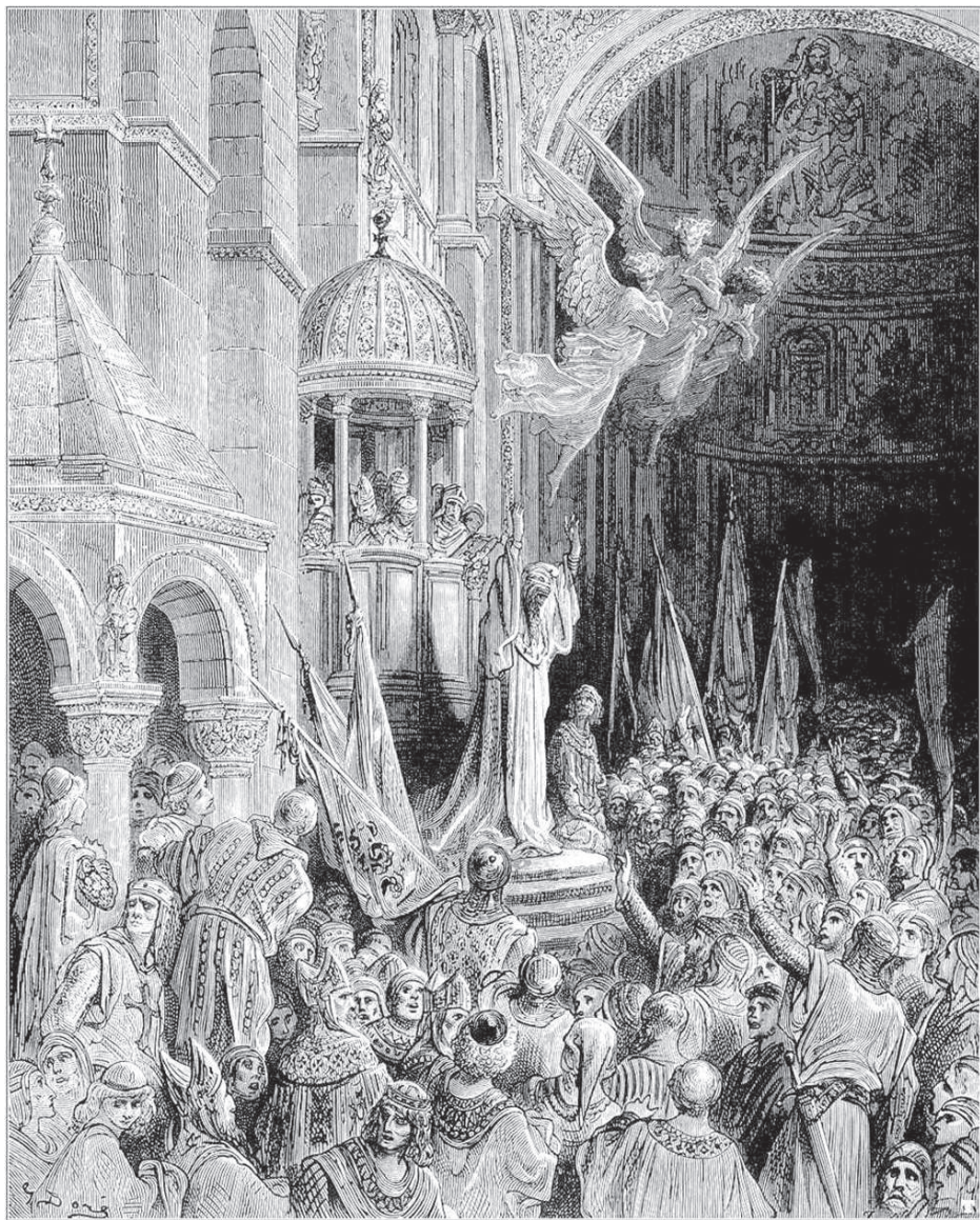
Гюстав Доре. Энрико Дандоло благословляет рыцарей. Около 1883 г.