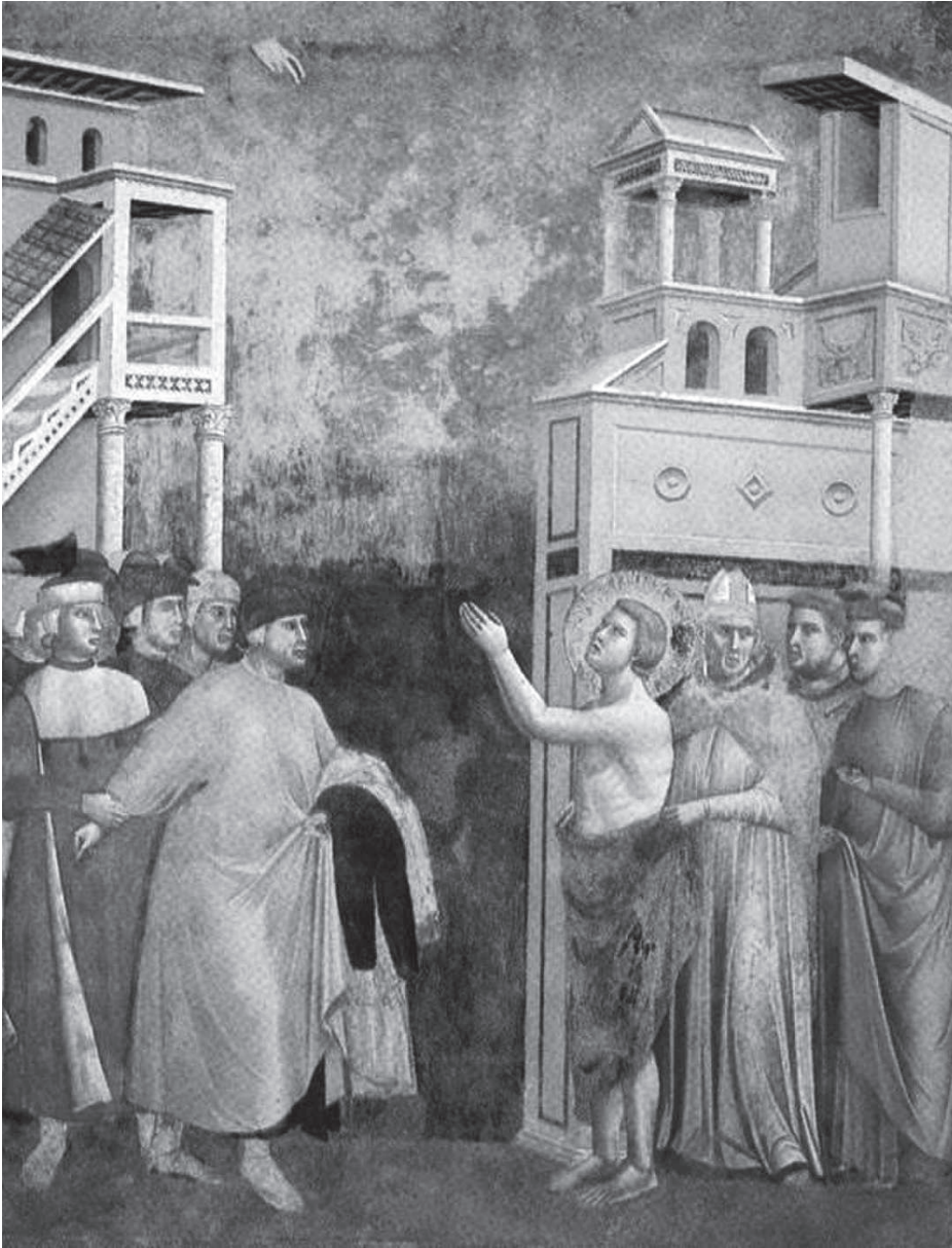
Джотто. Франциск Ассизский отказывается от имущества. Фреска в церкви Сан-Франческо в Ассизи. 1295 г.