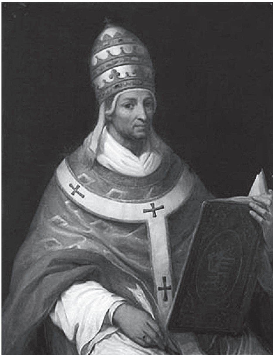
Анри Серрюр. Портрет папы Иоанна XXII. Около XIX в.