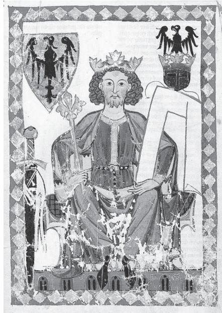
Император Генрих VI. Манесский кодекс. 1300 г.

В этот момент нашелся замечательный человек, который повел себя энергично и уверенно, — маршал Шампани Жоффрау де Виллардуэн. После Четвертого крестового похода он напишет (вернее, наверное, надиктует на французском языке) книгу «Завоевание Константинопо-