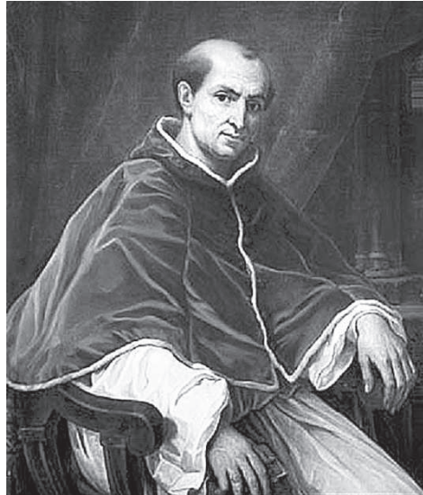
Анри Серрюр. Папа Климент V. XIX в.

ней мере в Европе (а деятели католической церкви мечтали распространить этот принцип на весь мир) превыше всех власть папы. Когда-то папская тиара состояла из двух плоскостей, а к концу XIII века — уже из трех, означавших три континента, известных людям того времени: Азию, Европу и Африку. То есть папа — владыка мира, и тиара это символизирует. Остальные: императоры, короли, герцоги (это уже просто мелочь) — все они под папой. Бонифаций VIII на этой мысли настаивал катего-