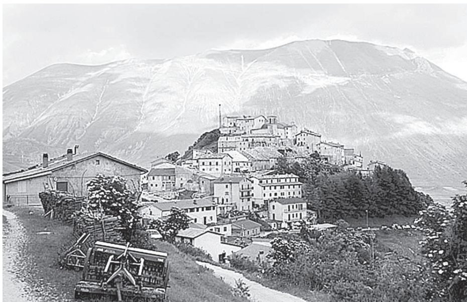
Умбрия. Гора Ветторе

зорванном платье, все отвергают: на нее лает собака, мальчишка замахнулся палкой, другие бросают камни — и только Франциск протягивает ей руку, а Христос благословляет их с небес.