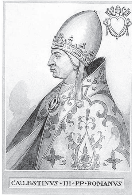
Алексис-Франсуа Арто де Монтор. Целестин III. 1842 г.

Смерть сына и мысль о проклятии убили Танкреда. Он тоже слег и через несколько месяцев умер в 1194 году. Подробности неизвестны. Сегодня мы сказали бы: стресс. Ведь произошло крушение его жизни, всего, чему он служил, чему отдавал свои незаурядные способности и в науках, и в управлении, и в дипломатии, и в военном деле. Он отдал все ради того, что в итоге потерял. Пришлось ли ему перед смертью подумать об истинных ценностях человеческого бытия? Может быть. А может быть, нет.