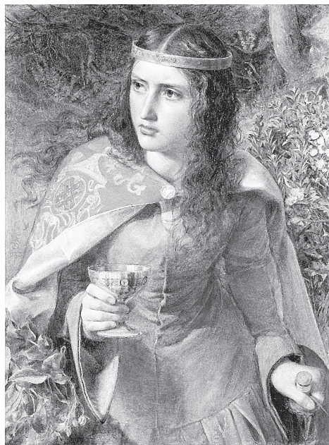
Фредерик Сэндис. Королева Алиенора. 1858 г.

ходилось передавать по женской линии. В Европе всегда были с этим проблемы, но у норманнов меньше, чем у других.