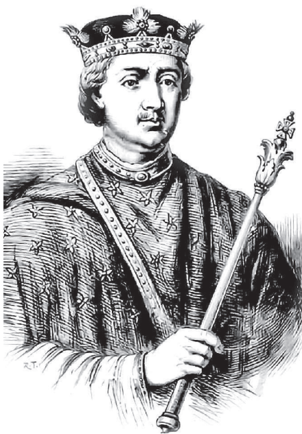
Король Генрих II