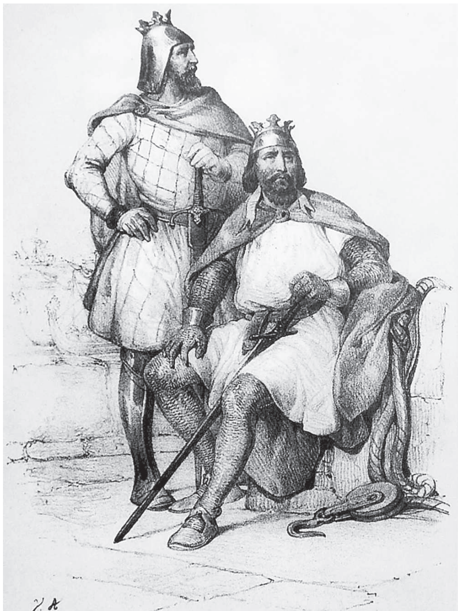
Роберт Гвискар (стоит) и его брат Рожер Сицилийский. Литография. Начало XIX в.