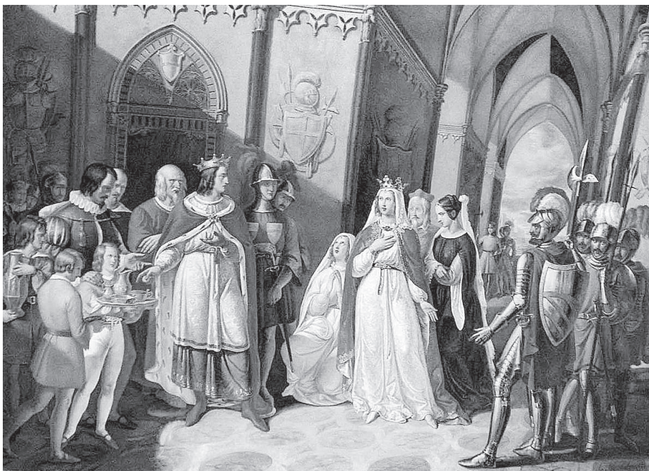
Дженнаро Малдарелли. Великодушный Танкред освобождает императрицу Констанцию. Фрагмент росписи потолка в Королевском дворце в Неаполе. 1840 г.

своей цели и, вероятно, буквально перед смертью понял, какую ошибку совершил. А вот историческая альтернатива чрезвычайно интересная.