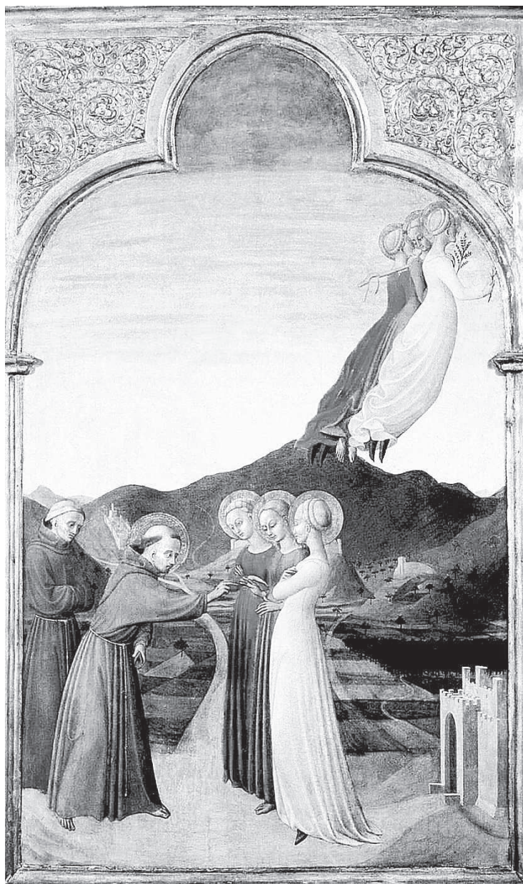
Стефано ди Джованни Сассетта. Обручение Святого Франциска с Госпожой Бедностью. Икона. XV в.