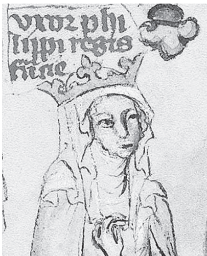
Неизвестный художник. Агнесса Меранская. XIV в.

Очень важно и то, что он проникает в Центральную Европу, например в Польшу. Там он боролся за моральную чистоту. Понятно, что это только лозунг. Правда, в личной жизни Иннокентий III не был таким вызывающим развратником, какими были и будут — особенно будут — многие римские папы. Идеализирующий его Л. Ранке пишет: «Он был безупречен в своей частной жизни». Насчет безупречности — это преувеличение, но дальше трогательное: «Он ничего не извлекал для себя из достоинства Церкви, даже расходы на путешествия оплачивались его личными средствами». То есть он