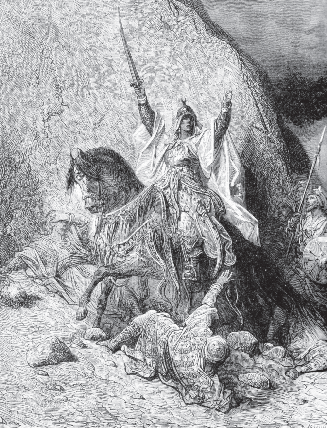
Гюстав Доре. Победоносный Саладин. Гравюра. XIX в.

регулярной армии, пользуясь исключительно наемниками. Многим казалось, и не зря, что у Византии легко что-нибудь отнять. Отнимали, возвращали... И она прожила в этом состоянии почти 800 лет.