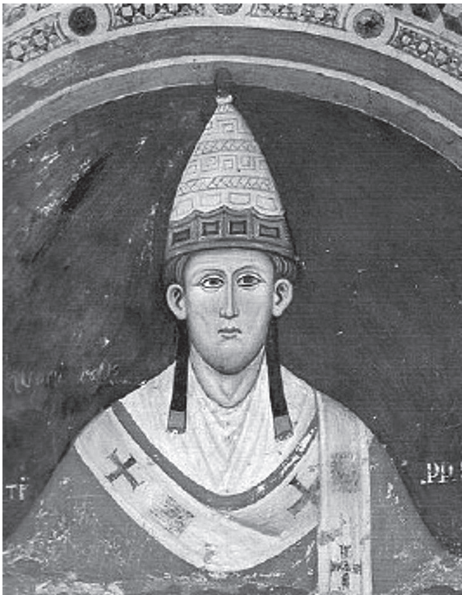
Неизвестный художник. Папа Иннокентий III. Фреска в монастыре Сакро Спеко. 1219 г.