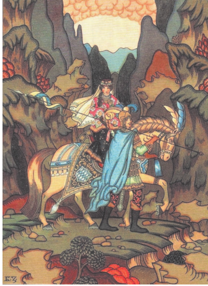
Б. Зворыкин. Иллюстрация к «Сказке о мертвой царевне и о семи богатырях» А.С. Пушкина

АМАЗО́НКА ж. — наездница; □ долгое, широкое женское платье, обычно суконное, для верховой езды.