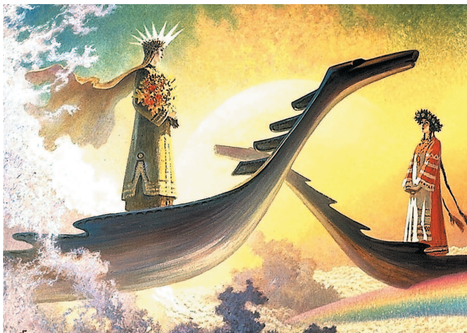
Аврора на картине художника Б. Ольшанского «У небесного причала»

А́ЗБУКА ж. — алфавит; собрание в порядке всех письмен, букв.