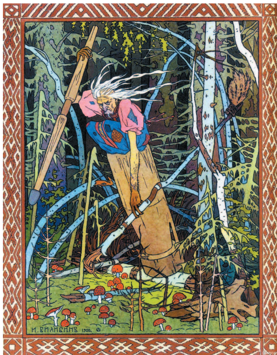
И. Билибин. Баба-Яга. Иллюстрация к сказке «Василиса Прекрасная»

БАБА-ЯГÁ или ягá-баба — сказочное страшилище, большуха [главная] над ведьмами, подручница сатаны; Баба-яга костяная нога: в ступе едет, пестом погоняет (упирается), помелом следы замечает ; она простоволоса и в одной рубахе, без опояски: то и другое верх бесчиния.