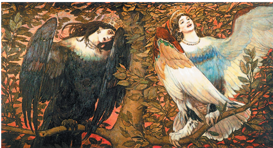
В. Васнецов. Сирин и Алконост

АЛКОНО́СТ м. — сказочная райская птица с человеческим лицом, изображавшаяся на наших картинах.