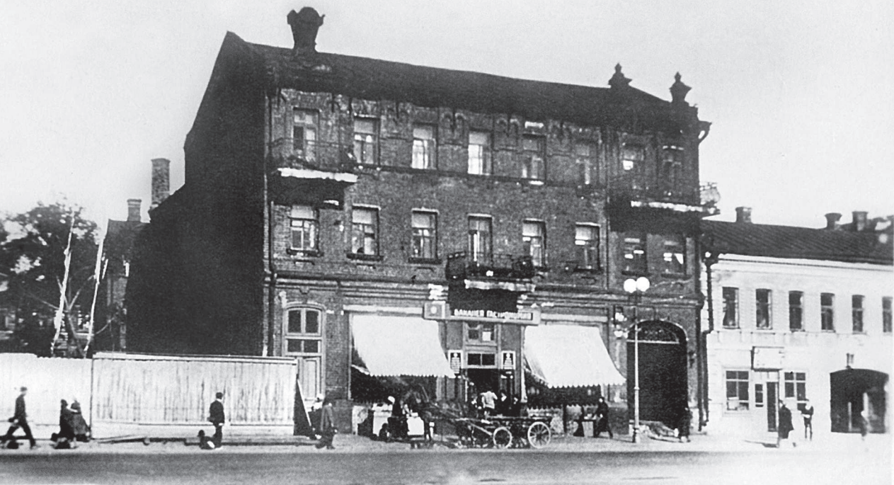
Дом № 126 на Первой Мещанской улице. Москва. 1930-е гг.