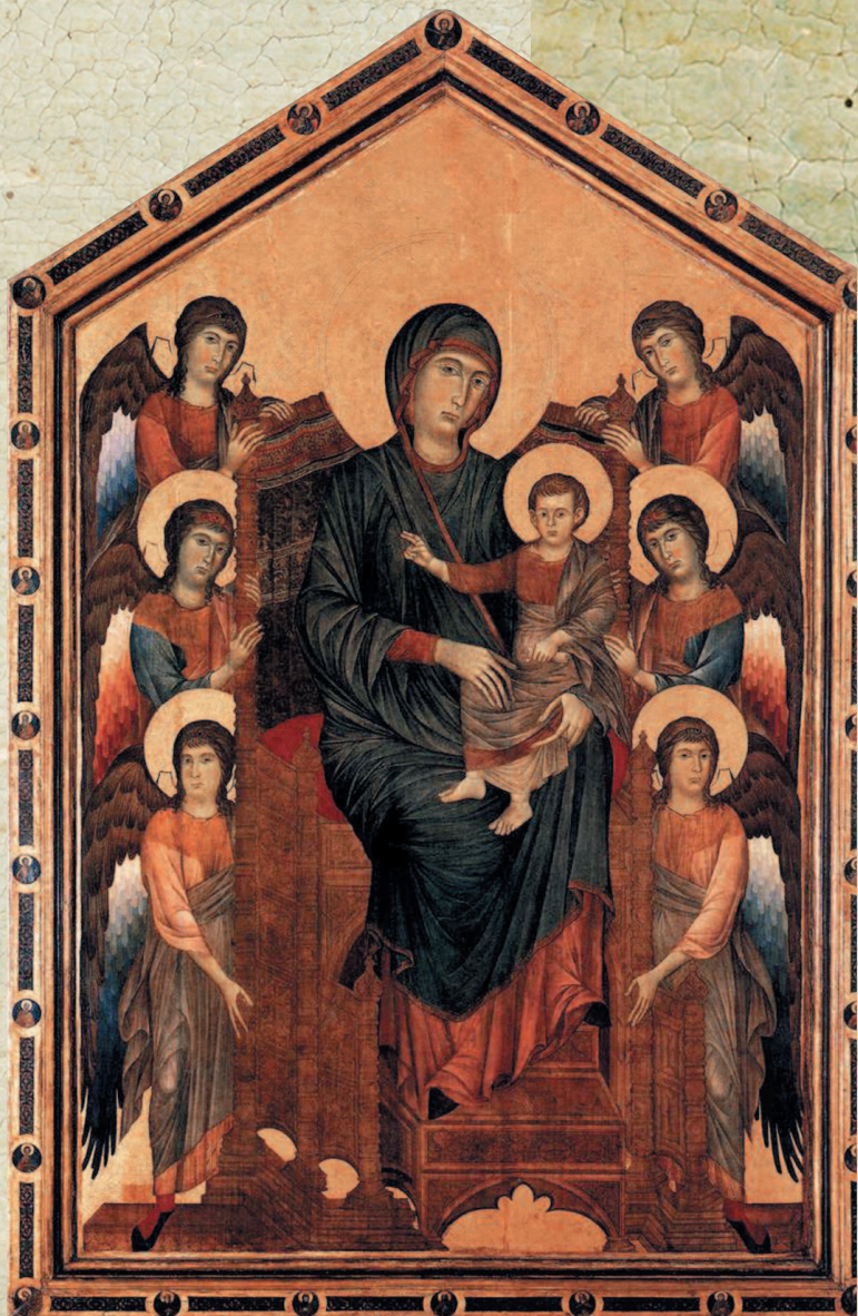
Чимабуэ. Мадонна на троне в окружении шести ангелов (1280). Лувр, Париж