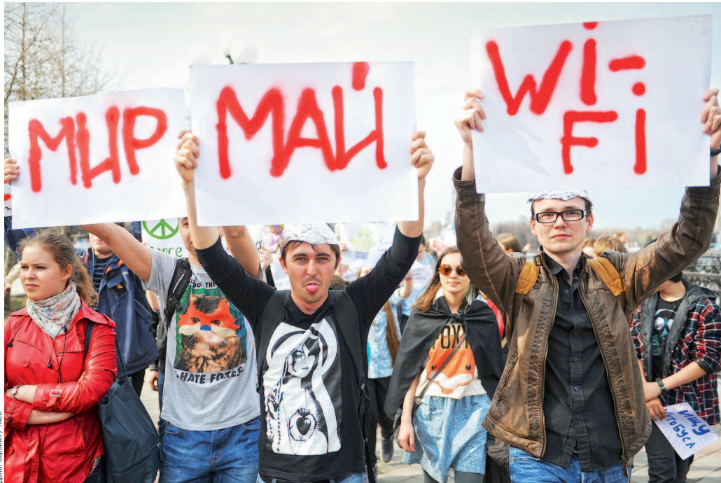
Раньше было «Мир. Труд. Май», но современный труд немислим без вайфая

В 2011 году Россия выходит на первое место в Европе по размеру месячной интернет-аудитории: 54 миллиона человек. Теперь число пользователей быстрее всего растет в сельской местности и в небольших городах. Жители мегаполисов уже подключены к интернету дома, власти и частный бизнес строят там публичные сети вайфая