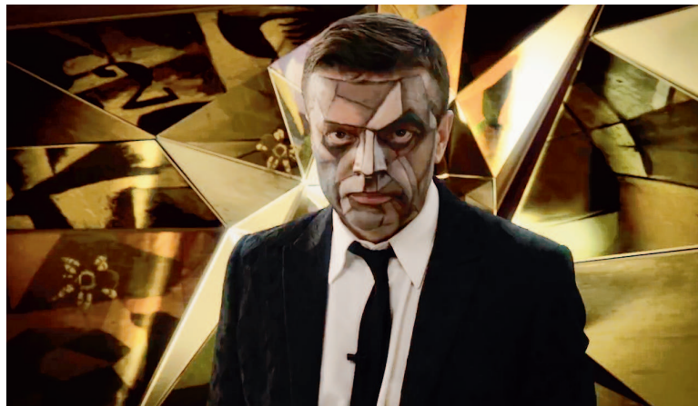
Фильм «Глаз Божий» (две серии, 2012). Комментарий о кубизме Пикассо в коллекции С. И. Щукина