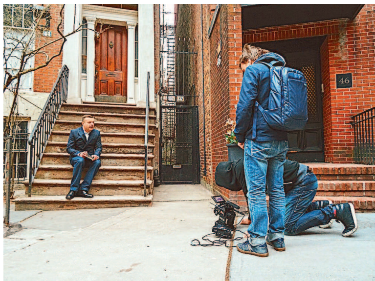
Проект «Русские евреи» (три фильма, 2014–2015). Комментарии на местах Кишиневского погрома 1903 года и на крыльце дома Иосифа Бродского в Нью-Йорке

Для меня это тоже были годы сугубо частных проектов. Тома «Намедни» и начинались как личная инициатива, а после 2010-го уже не было и фильмов по заказу телекомпаний. Теперь же интернет раскрутился настолько, что эфирные каналы стали вовсе не нужны. Часть контраста: официальные СМИ становились строже, а неофициальные – свободнее. Как говорил один давнишний киногоерой: значит, будем жить!