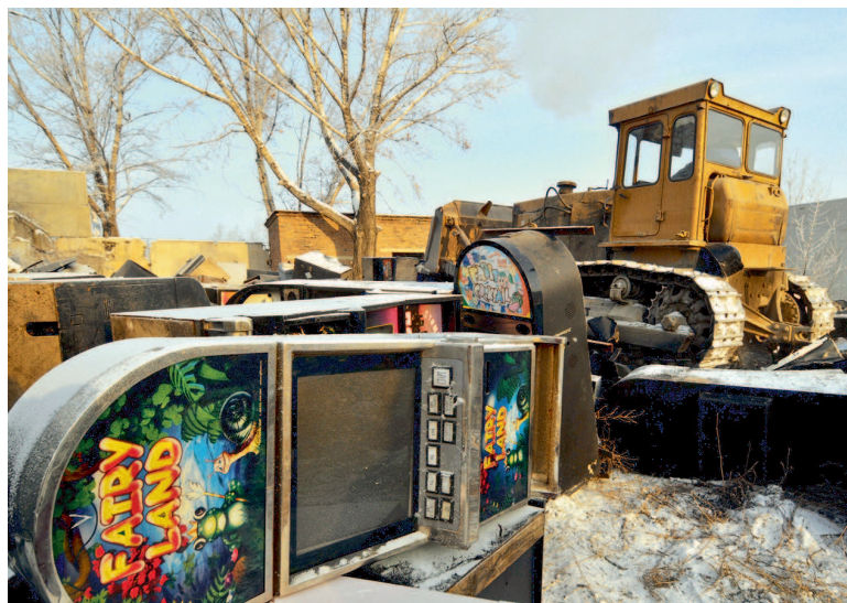
Ликвидация подпольных казино в Подмоскowie – война недавних коллег по прокуратуре

Известно всем, Что общий дом под именем СК Возьмет заботу обо всём, Коль в доме есть беда.