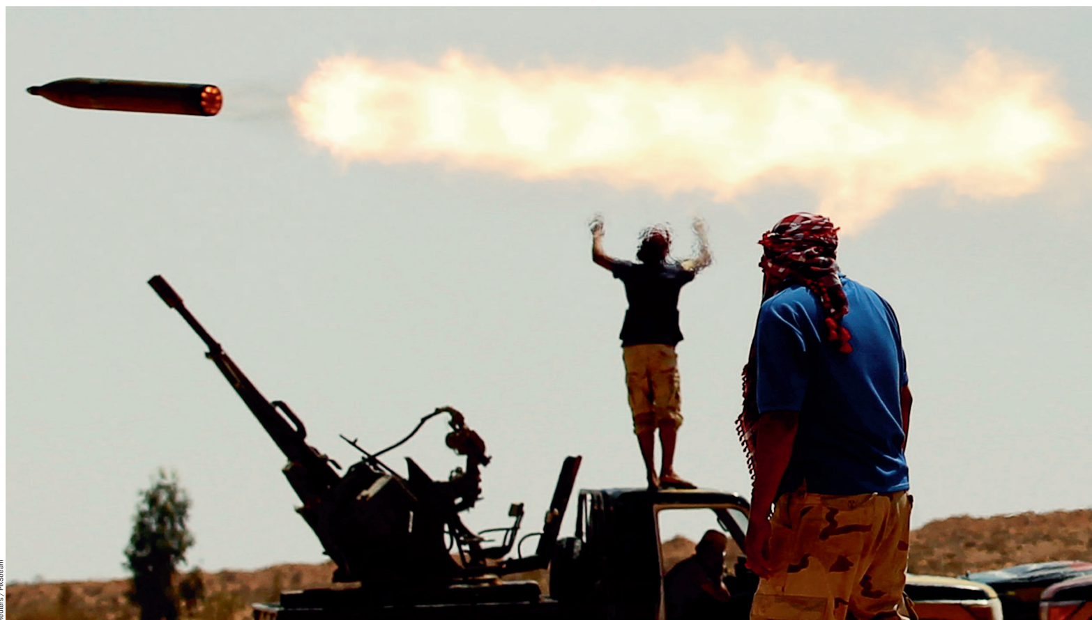
Даже при поддержке Запада ливийские повстанцы воюют с Каддафи более полугода

В Ливии, где 42 года царствует полковник Муаммар Каддафи, протесты быстро