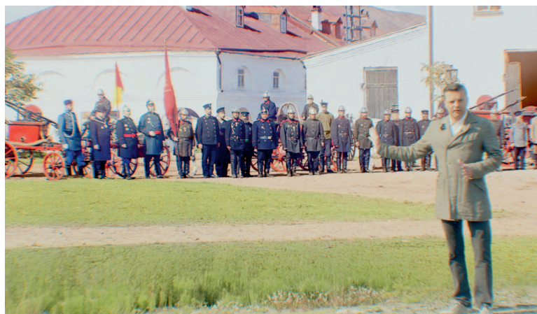
Фильм «Цвет нации» (2013). Комментарии «внутри» цветных фотографий С. М. Прокудина-Горского, снятых в 1909 году