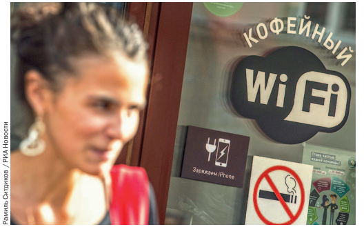
Есть вайфай и зарядка для мобильного – в кафе можно сидеть весь день

Р аспространенный стандарт беспроводной связи, вайфай существует уже больше 10 лет. Конечно, удобнее поставить дома роутер – маршрутизатор с антенной – вместо того, чтобы по старинке возиться с проводами. На небольшом расстоянии сигнал доступен и через стены – продвинутые пользователи проверяют, нет ли у соседей незапароленного вайфая.