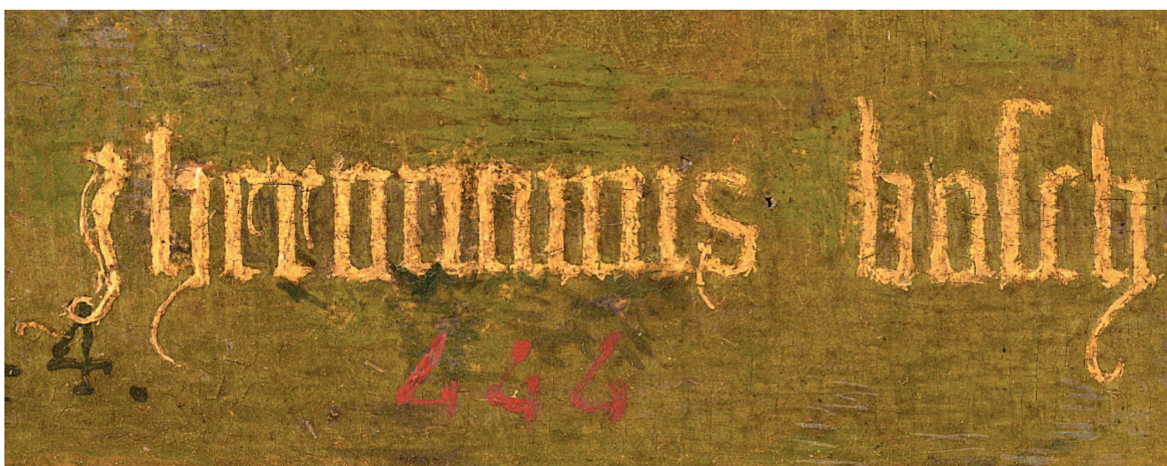
Автограф Иеронима Босха

Родовая фамилия Иеронима «ван Акен» связана с происхождением семьи из немецкого города Аахен. Прадедушка Иеронима — Томас ван Акен (ок. 1355–1404/10 годы) — переехал из Аахена в Неймеген (герцогство Гелдерланд, Нижние земли) в 1404 году и значился живописцем по профессии, как сообщают архивные записи. В XV веке Неймеген считался настоящим центром искусств со своей школой: оттуда происходят и братья ван Эйк, и братья Лимбург, и братья Майвайль.