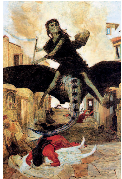
Арнольд Бёклин. Чума, 1898 г. Базельский художественный музей, Базель