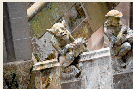
Детали экстерьера собора Святого Иоанна