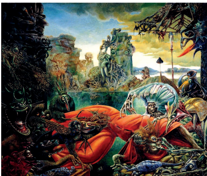
Макс Эрнст. Искушение святого Антония, 1945 г. Музей Вильгельма Лембрука, Дуйсбург