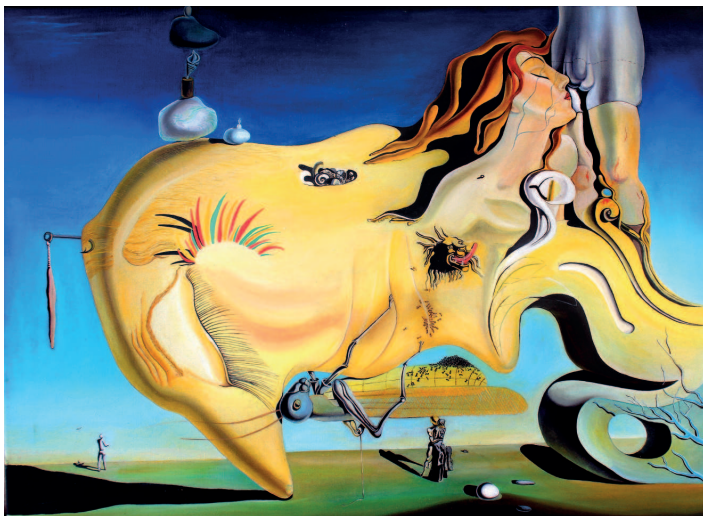
Сальвадор Дали. Великий Мастурбатор, 1929 г. Центр искусств королевы Софии, Мадрид