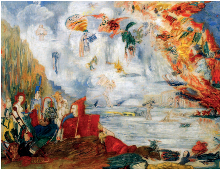
Джеймс Энсор. Искушения святого Антония, 1909 г. Музей современного искусства, Нью-Йорк