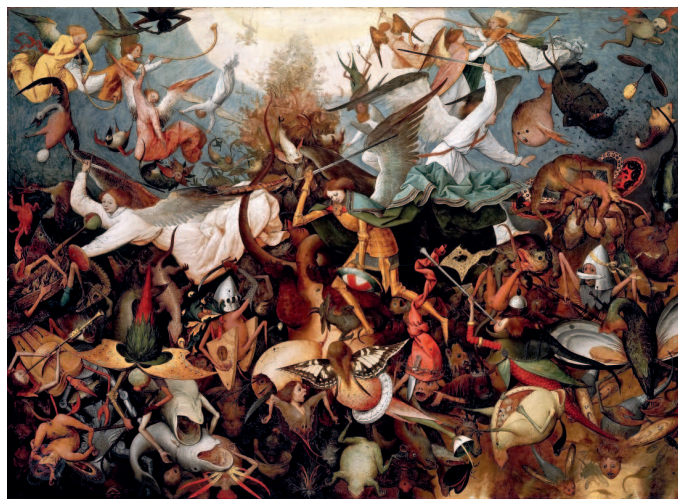
Питер Брейгель Старший. Падение мятежных ангелов, 1562 г. Королевские музеи изящных искусств, Брюссель