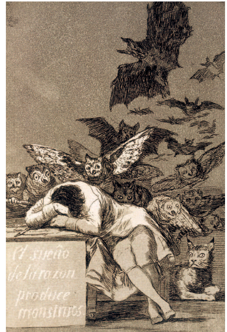
Франсиско Гойя. Сон разума рождает чудовищ, 1797–1799 гг. Национальная библиотека Испании, Мадрид

Даже всей совокупности идей и книг, гипотез и результатов, исследований и предположений никогда не будет достаточно, чтобы объяснить гений художника и культурный код его эпохи. Как писал о Босхе один из крупнейших искусствоведов XX века Эрвин Панофский: «Мы просверлили несколько отверстий в двери закрытой комнаты, но ключа к ней, кажется, так и не подобрали». Неизведанное и непроявленное, нераскрытое и загадочное манит нас и влечет в уникальный мир этого художника, мыслителя, творца — Иеронима Босха.