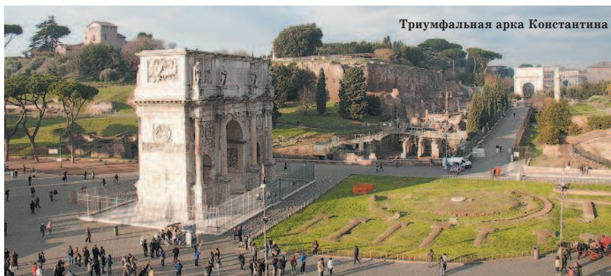
Триумфальная арка Константина

После посещения Колизея, который производит на туристов весьма разное и часто удручающее впечатление, вам наверняка захочется отдохнуть в одном из кафе, которые призывно расположились на террасе на Via Nicola Salvi. Не рекомендуем вам этого делать, поскольку данные заведения умеют удивлять клиентов цифрами в счете.