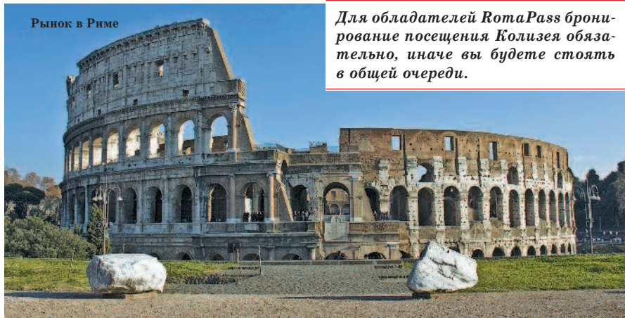
Рынок в Риме

Для обладателей RomaPass бронирование посещения Колизея обязательно, иначе вы будете стоять в общей очереди.