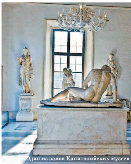
Один из залов Капитолийских музеев

В самом центре Рима в сезон бывает нелегко найти достойный resto-