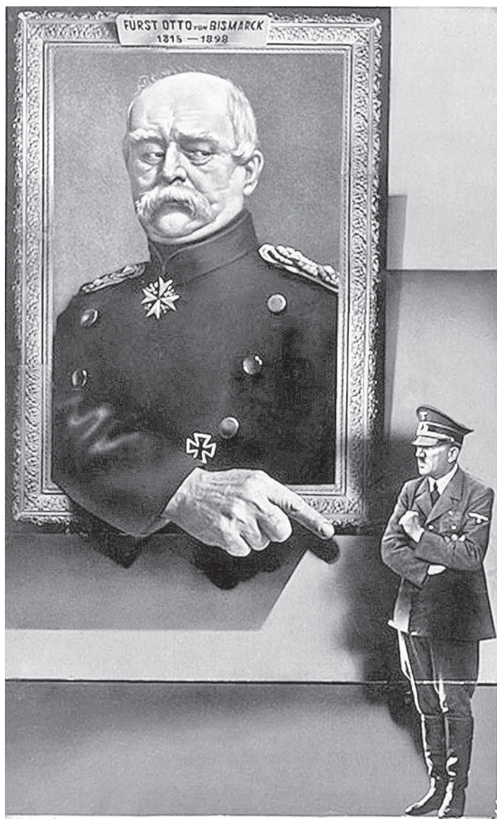
Этот ефрейтор ведет Германию к катастрофе Листовка