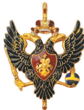
Звено орденской цепи.

За время царствования Петра I (до 1725 г.) орденом Святого апостола Андрея Первозванного были пожалованы 38 человек. Его преемники этой наградой жаловали нечасто. Правда, императрица Екатерина I Алексеевна (1684—1727) за 2 года и 3 месяца своего царствования наградила 18 человек, т. е. по 9 в год. Дочь Петра I Елизавета Петровна (1709—1762) за 20 лет правления пожаловала орден 83 подданным. При Екатерине II (1729—1796) за 33 года ее царствования орден пожаловали 100 подданным.