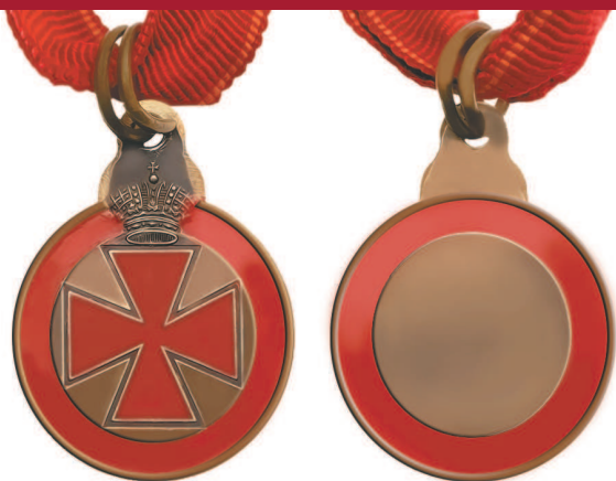
Аннинская медаль — Знак отличия ордена Святой Анны (аверс и реверс).

Первым орденом, к которому был представлен будущий великий полководец А. В. Суворов, стал как раз орден Святой Анны. Эту же награду еще при императрице Елизавете Петровне получил отец Суворова. В 1789 г. ордена Святой Анны удостоился будущий победитель Наполеона М. И. Кутузов.