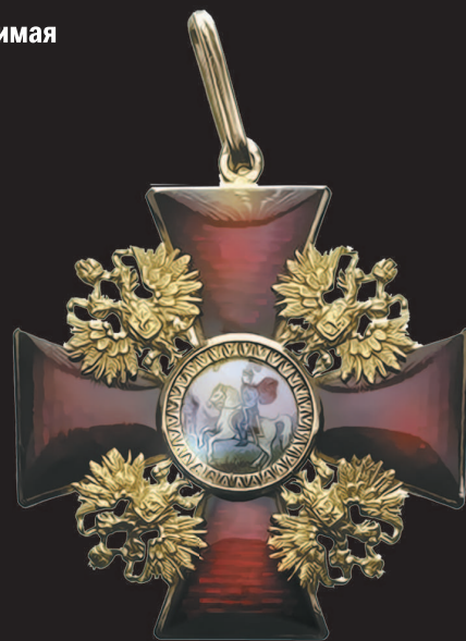
Крест ордена (аверс и реверс).

Лента красная, носимая через левое плечо.