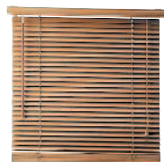
le store vénitien жалюзи