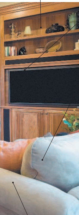
le vaisselier сервант