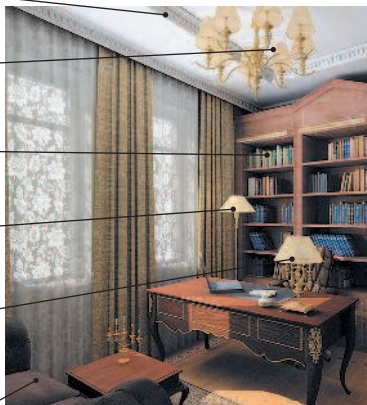
le bureau кабинет