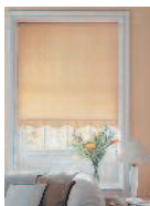
le store штора