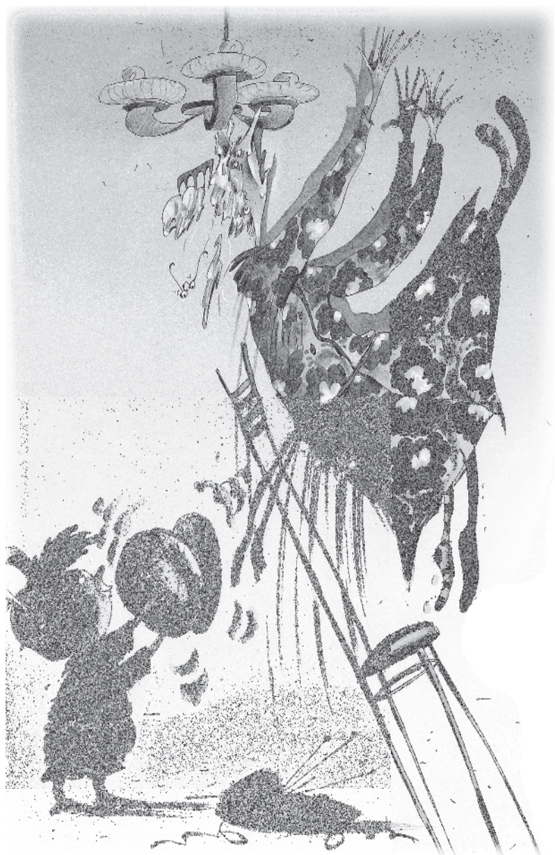
Художник Андрей Мартынов