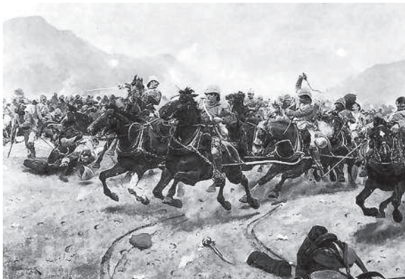
Бегство Королевской конной артиллерии в битве под Мейвандом

«Переведенный из своего полка в Беркширский, я участвовал в роковой битве при Мейванде».