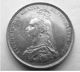
Шиллинг с изображением королевы Виктории. 1887 г.

«...насколько может быть свободен человек, получающий одиннадцать шиллингов и шесть пенсов в день». Шиллинг ( shilling ) — общее название европейских монет, произошедшее от солида — римской золотой монеты. В Англии долгое время был лишь денежно-счетной единицей (до нормандского вторжения равнялся 5 пенсам, после него и вплоть до 1971 года — 12 пенсам; 20 шиллингов равнялись 1 фунту стерлингов). Но как монета стал чеканиться лишь в 1502 году в правление Генриха VII. В конце XIX века 11 шиллинг в день — средняя сумма, впрочем немалая. За один шиллинг на городском базаре можно было купить самое дорогое кушанье того времени — ананас! Пузырек с лекарством стоил полтора шиллинга. А торговцы на рынке, как свидетельствуют, получали «баснословные деньги», а именно 20—30 шиллингов в день! Одно время Доил подрабатывал помощником врача в Бирмингеме, и некий доктор Хор, как свидетельствуют биографы, ему неплохо платил — два фунта в месяц, т. е. 40 шиллингов. На большее студент-медик, еще пока недоучка, претендовать и не мог. Но Доил смог за полгода скопить неплохую сумму — практика, которой следует каждый британец: главное не уровень дохода, а умение экономить! Пенни ( penny ), иногда пенс ( pence ) (во мн. ч. пенсы ( pence )) для начисления суммы, пенни ( pennies ) для нескольких монет) — английская монета, чеканившаяся с XI века из серебра, меди, бронзы, а также разменная монета современного Соединенного Королевства, составляет сотую долю фунта стерлингов.