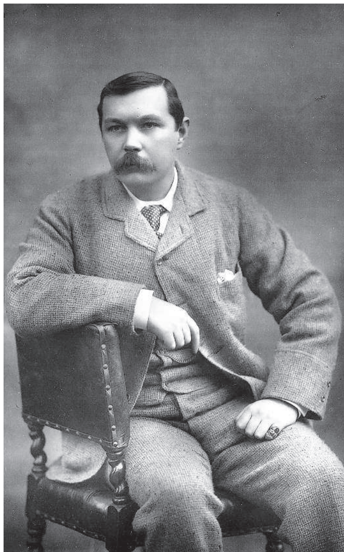
А. К. Дойл в 1893 г.

В то же самое время Лондон той эпохи — это клоака, город контрастов, где уживаются англичане, ирландцы, индийцы, китайцы, африканцы, а роскошь соседствует с нищетой. Вот в такую эпоху и появляется декадент Шерлок Холмс (Дойл, кстати, несколько раз встречался с Оскаром Уальдом — лидером британского декадентства). В то время декадентство — это своеобразный бунт против викторианского образа жизни, некоторая эстетическая независимость и даже жизненная позиция. Шерлок