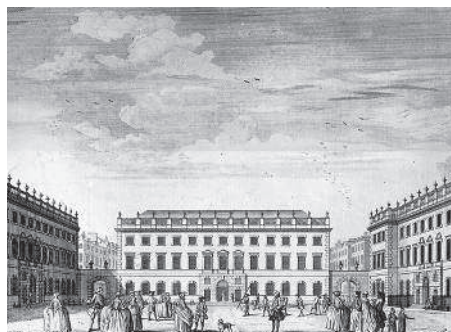
Королевский госпиталь Святого Варфоломея. 1752 г.