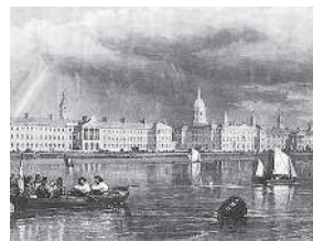
Королевский госпиталь Нетли