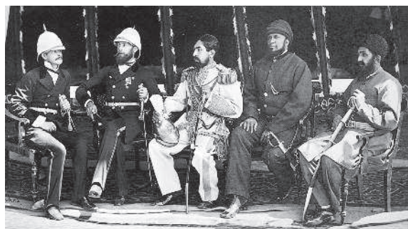
Якуб-хан и Пьер Луи Каваньяри во время подписания договора 26 мая 1879 г.

«Мой полк в то время стоял в Индии, и, прежде чем я прибыл на место службы, началась Вторая афганская кампания». Вторая афганская кампания — колониальная война Великобритании с целью установления контроля над Афганистаном (1878—1880). Лояльный британцам Якуб-хан уступил им часть своей территории и допустил в Кабул английского резидента, сэра Луи Каваньяри. Через несколько месяцев резидент был убит вместе со своей свитой, а Якуб-хан отрекся от престола и бежал в Индию. Британцы вторглись в Афганистан и заняли Кабул и Кандагар. Но с конца 1879 года в стране разрослось народное восстание, в котором приняли участие до 100 тыс. человек, а лидер восставших Абдур-Рахман нашел поддержку у России. В ходе переговоров он добился от британцев признания его правителем страны. 22 июля 1880 года князя Восточного и Среднего Афганистана провозгласили Абдур-Рахмана новым эмиром. Установив в Кабуле новое правительство, британцы покинули страну.