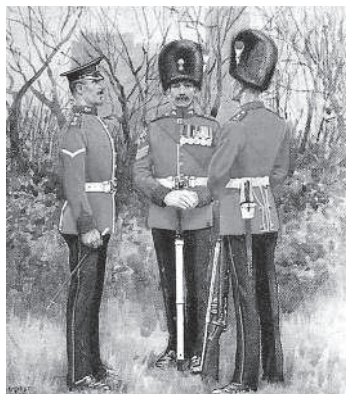
Офицер и солдаты Пятого Нортумберлендского стрелкового полка

«...я был приписан в качестве ассистента хирурга к Пятому Нортумберлендскому стрелковому полку». Ныне Королевский нортумберлендский стрелковый полк. Участвовал практически во всех войнах, что вела Великобритания с конца XVII века: в войне против яковитов в Ирландии (1690—1691), в войне за испанское наследство (1707—1713), в англо-испанской войне (1727), в Семилетней войне (1756—1763), в американской Войне за независимость (1775—1783). В 1778 году полк был отправлен из Америки в Индию, где противостоял французским войскам. Вернувшись в Европу, в начале XIX века полк участвовал в действиях против наполеоновских войск на Пиренейском полуострове и за свои боевые заслуги получил прозвища Старые и смелые , Сражающаяся пятерка , Охранники лорда Веллингтона . В 1857 году полк участвовал в подавлении индийского восстания, а в 1878—1880 годах — во Второй англо-афганской войне, на которую и попал доктор Уотсон.