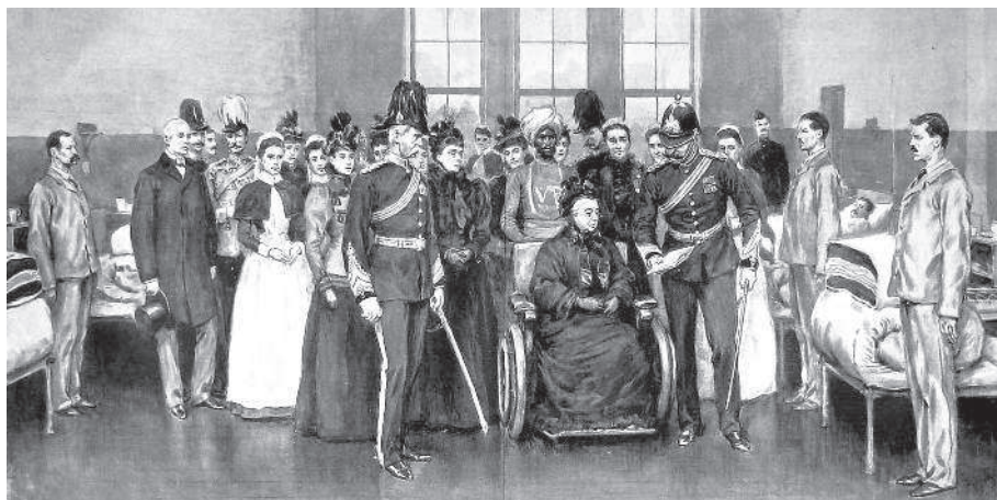
Посещение королевой Викторией госпиталя Нетли

«В 1878 году я получил степень доктора медицины в Лондонском университете и отправился в Нетли...» Нетли (Netley) — королевский военный госпиталь, расположенный неподалеку от Саутгемптона. Во время Крымской войны (1854—1856) стало очевидно, что антисанитарное состояние больниц в Великобритании может привести к катастрофе. В 1856 году по предложению королевы Виктории, которая «заложила первый камень будущего здания», началось строительство нового госпиталя. Дизайн активно обсуждался в прессе, в частности премьер-министром Великобритании лордом Палмерстоном, который в какой-то момент считал, что «планировка здания не способствует тому, чтобы будущий госпиталь служил нуждам пациентам, а сооружается как памятник тщеславию архитектора». Тем не менее здание было возведено, полностью отвечало архитектурным нормам и соответствовало своему предназначению.