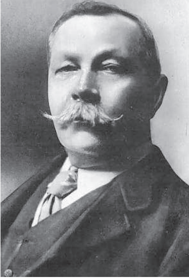
Артур Конан Дойл