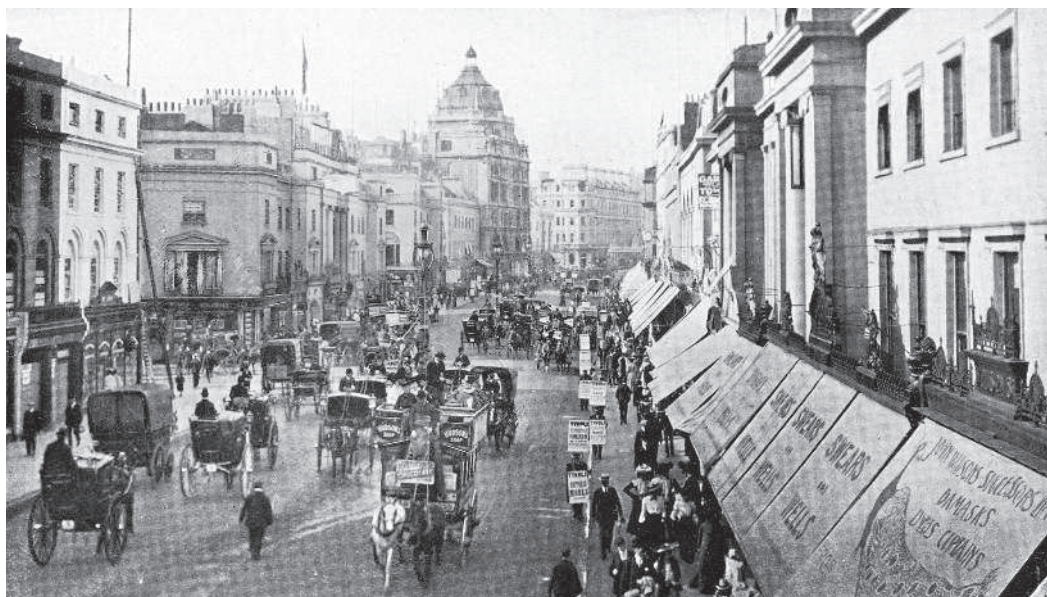
Лондон. Конец XIX в.

«В подобных обстоятельствах меня, естественно, потянуло в Лондон, в этот отстойник, куда непреодолимо стекаются все празднующиеся бездельники империи». За XIX век Лондон стал крупнейшим городом мира. Его население в 1800 году составляло 1 млн, а веком позже — 6,7 млн. За это время Лондон стал всемирной политической, торговой и финансовой столицей. Отстойником город назван поскольку, несмотря на то что здесь строились фешенебельные районы, Лондон XIX века был городом нищеты, где миллионы людей