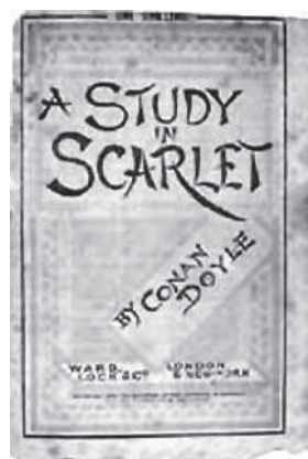
«Этюд в багровые тонах». Первое отдельное издание. 1888 г.

Этюд в багровых тонах ( A Study in Scarlet ). Первоначальное рабочее название «Запутанный клубок» ( The Tangled Skein ). Именно с этой повести Дойл становится известен как писатель детективов и воспринимается чуть ли не основателем этого жанра. Но на момент создания «Этюда в багровых тонах» уже было опубликовано множество детективных историй. Их писали Чарльз Диккенс, Уилки Коллинз и др. Сам Дойл называет только двоих писателей, на чье творчество он опирался: Эдгар По и Эмиль Габорно.