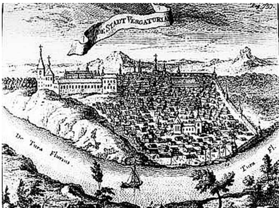
Гравюра, XIX век.

кровлю одиннадцать. Вообще высота, длина и ширина башен была очень различна и не одинакова в одном и том же городе. Например, в Воронеже в 1666 году одна башня имела в вышину семь сажень, а другие — пять, четыре, три и даже одну. Вышина вообще не соразмерялась с объемом башен; например, в одном городе из двух башен в полторы сажени в диаметре одна была вышиною в три сажени с половиною, другая в полторы сажени. Редко длина башни была одинакова с шириною. Чаще всего в одну сторону они были длиннее, в другую, внутреннюю, короче, например, четыре сажени длины и две с половиною ширины. Но самая обыкновенная мера башен была около трех сажень в длину и двух в ширину. В некоторых городах башни строились в уровень со стеною, в других выступали сажени на две, на три и даже на четыре в наружную сторону. Количество ба-