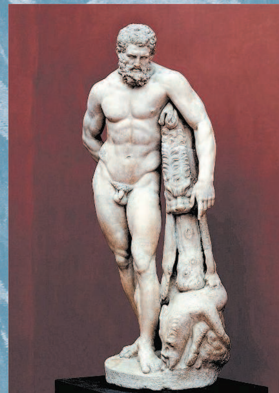
Геркулес Фарнезский, III в. н. э.

Веселье и радость воцарились на острове. Всюду на кострах сжигались жертвы богам, празднества сменялись празднествами, пиры —