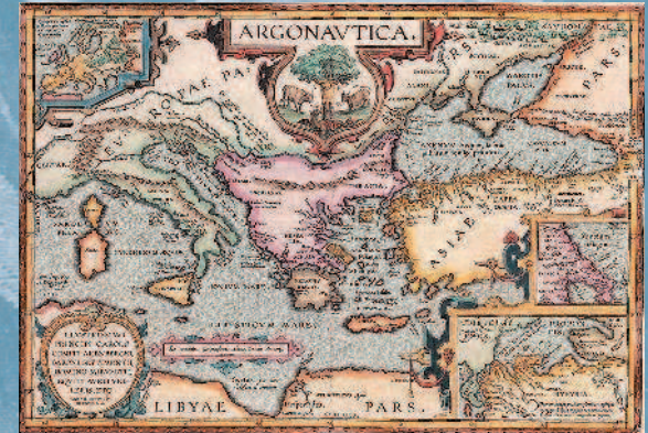
Карта путешествий аргонавтов в интерпретации Аполлония Родосского. Оттиск Абрахама Ортелиуса, 1624 г.

А аргонавты, лишь только взошла на небо лучезарная утренняя звезда, предвещающая скорое наступление утра, отправились в путь, не заметив в предзвездных сумерках, что нет среди них ни Геракла, ни Полифема. Опечалились герои, увидав, когда наступило утро, что нет между ними двух славнейших товарищей. Опустив голову, сидел в горе Ясон;