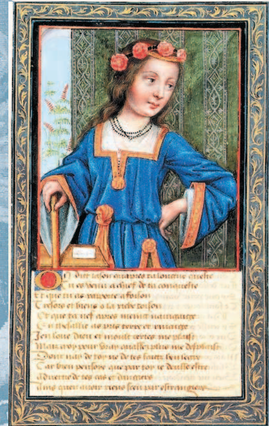
Царица Гипсипила. Миниатюра французской школы. XV в. Хантингтонская библиотека. Сан-Марино.

В честь прибытия героев царица Гипсипила учредила состязания по многоборью (пентатлону), которые включали в себя бег, метание диска и копья, прыжок и борьбу. Таким образом, остров Лемнос стал прародиной современного пятиборья.