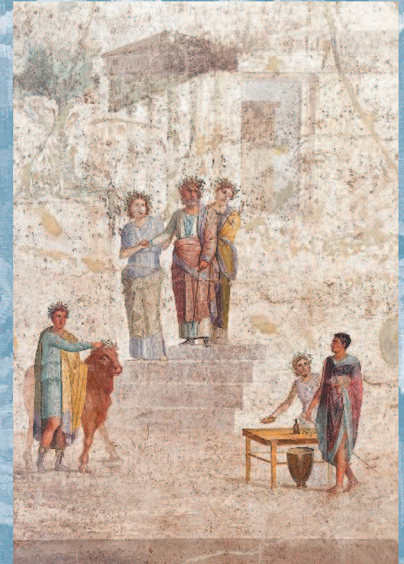
Пелий, царь Иолка, узнает молодого Ясона по отсутствию сандалии на одной ноге, римская фреска, I век н. э.

Так ответил Пелий Ясону, затаив злобу в сердце. Он верил, что погибнет Ясон, если решиться отправиться за золотым руном в Колхиду.