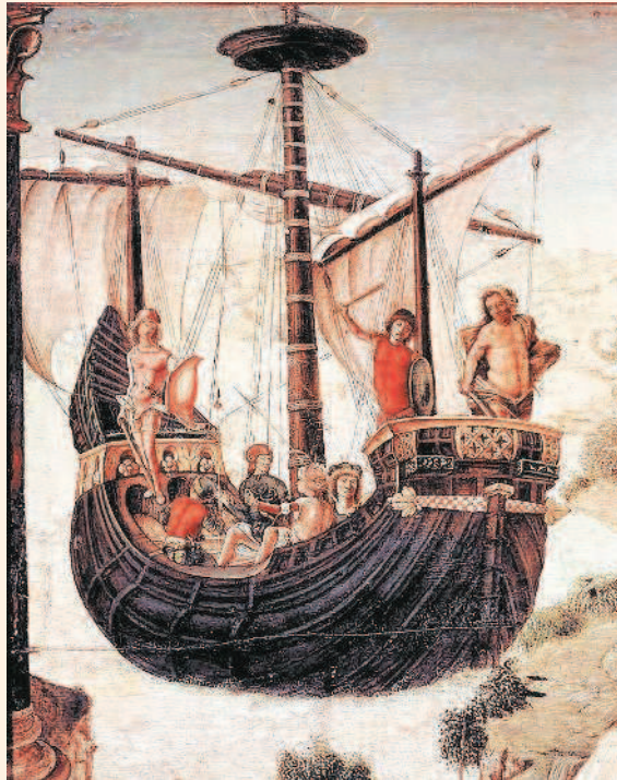
Лоренцо Коста. Корабль аргонавтов. XVI в.

Лишь только край неба загорелся пурпурным светом утренней зари, как разбудил кормчий Тифий аргонавтов. Взошли аргонавты на корабль и сели на весла, по два на каждую лавку. Дружно налегли на весла могучие гребцы. Гордо выплыл «Арго» из гавани в открытое море. Подняли пловцы белоснежный парус. Попутный ветер надул парус, и быстро понесся легкий корабль по приветливо шумящим волнам. Вот на колеснице, запряженной белоснежными конями, поднялся на небо лучезарный бог солнца Гелиос. Розовым светом окрасился парус «Арго», и засверкали волны моря в утренних лучах солнца.