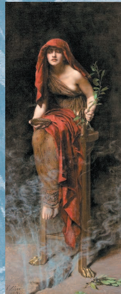
Джон Кольер. Дельфийская жрица. 1891 г.

Все было уже готово для жертвоприношения. Пасть под ножом жреца должен был юный Фрикс, но вдруг явился златорунный овен, дар бога Гермеса. Послала овна мать Фрикса, богиня Нефела, чтобы спасти своих детей. Сели на златорунного овна Фрикс с сестрой своей Геллой, и овен понес их по воздуху далеко на север.