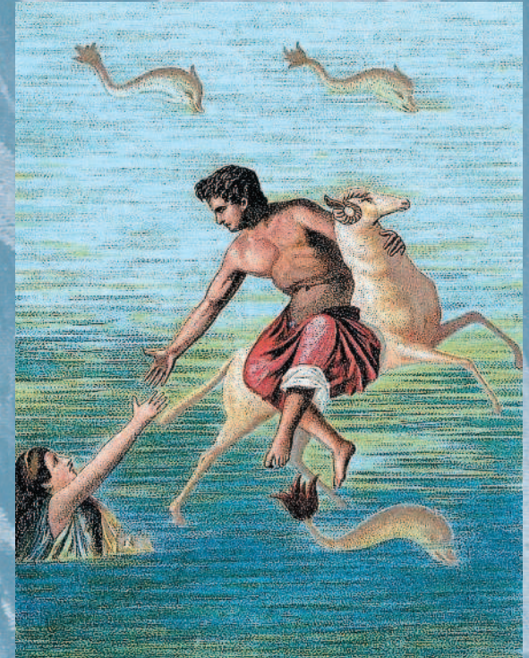
Фрикс и Гелла. Римская фреска, найденная в Помпеях.

— Откуда ты родом, юноша, к какому племени принадлежишь? Но только отвечай правду, не оскверняй себя ложью, я — враг ненавистной лжи.