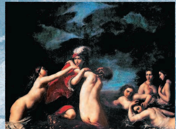
Франческо Фурини. Гилас и нимфы. XVII в. Палаццо Питти. Флоренция.