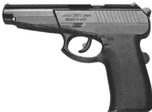
Пистолет СПС «Гюрза»

Боевые качества пистолетного комплекса в основном определяет 9-мм патрон РГ052 (9×26) обр. 1993 г., созданный А. Юрьевым. Он имеет пулю оригинальной конструкции с повышенным пробивным и останавливающим действием. Мощный патрон потребовал выполнить автоматику пистолета с массивным затвором-кожухом. В боевом положении он полностью накрывает ствол. Пистолет имеет два автоматических предохранителя: один в виде кла-