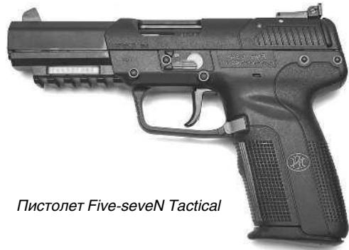
Пистолет Five-seveN Tactical

Калибр..... 9×19 мм Par Длина..... 198 мм Длина ствола..... 112 мм Масса без патронов..... 950 г Емкость магазина..... 18 патронов Начальная скорость пули..... 450 м/с Прицельная дальность..... 50 м