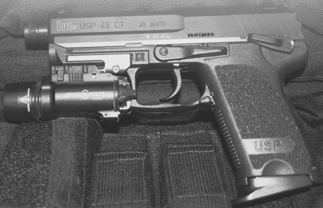
Пистолет USP 45 CT

Этот пистолет продолжает линию Beretta M8000 Cougar, уна-