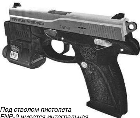
Под стволом пистолета FNP-9 имеется интегральная направляющая для крепления фонаря или лазерного прицела

Одной из особенностей пули SS190 является способность пробить стандартный кевларовый бронезилет; при испытаниях