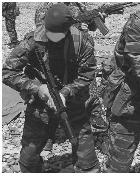
Боец армейского спецназа с пистолетом-пулеметом АЕК-919К

свободного затвора, выстрел происходит при незапертом затворе. Затвор массивный, набегающего на ствол типа. Запирание канала ствола осуществляется массой затвора, поджимаемого возвратной пружиной. УСМ ударникового типа позволяет вести одиночный и автоматический огонь. Рукотка перезаряжания не связана жестко с затвором и при стрельбе находится в крайнем переднем положении. В 2004 г. АЕК-919К успешно прошел комплексные испытания по методике Министерства обороны РФ. Эти пистолеты-пулеметы применяли в ходе боевых действий на территории Чечни некоторые спецподразделения ФСБ; также их получали