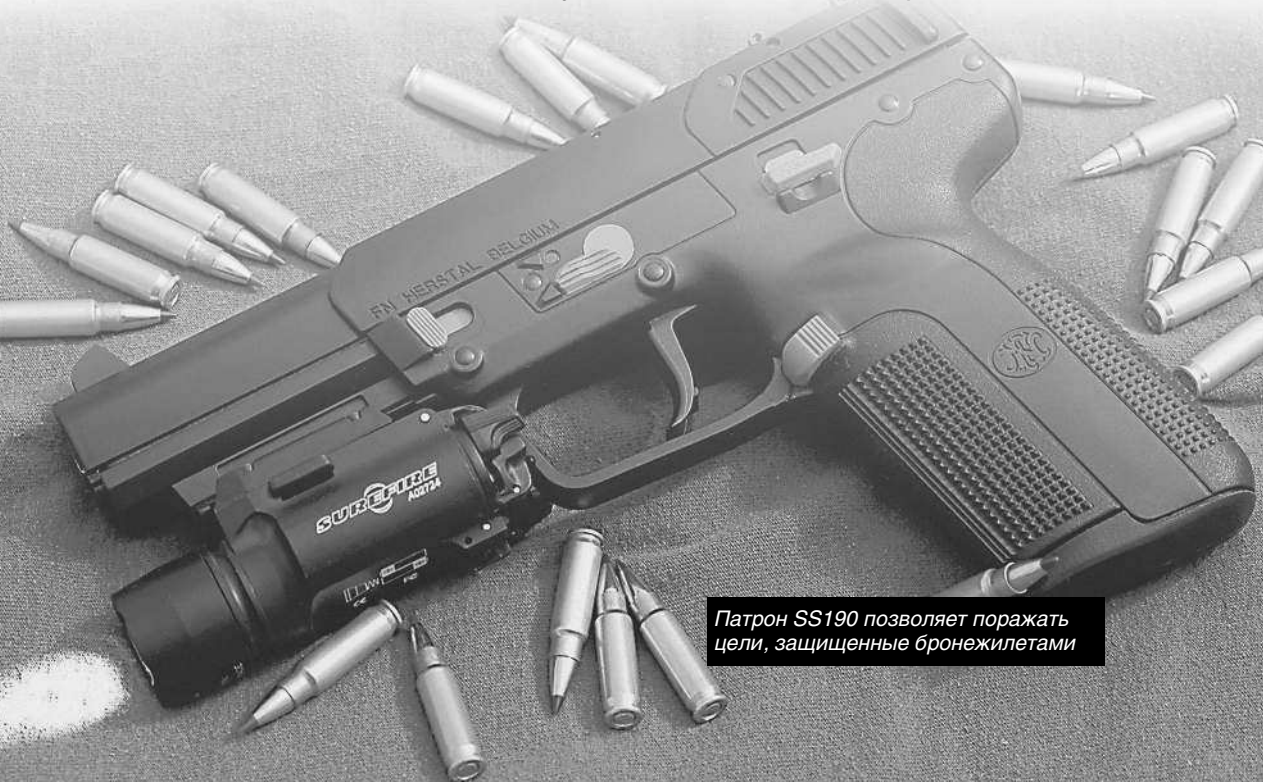
Патрон SS190 позволяет поражать цели, защищенные бронежилетами

Наиболее значимая особенность Five-seveN — это патрон 5,7×28 мм