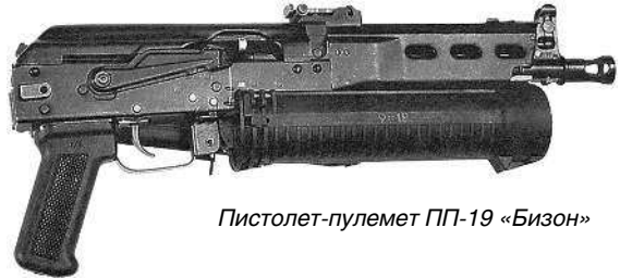
Пистолет-пулемет ПП-19 «Бизон»

нового поколения оружия данного класса. Его отличительные особенности: мгновенное приведение в боевую готовность, безопасность обращения, продолжительное ведение огня без смены магазинов, возможность скрытого ношения и хорошая кучность. Подобное индивидуальное автоматическое огнестрельное оружие сегодня предназначено для вооружения личного состава, подразделений воздушно-десантных и специальных войск, экипажей боевых машин и расчетов тяжелого (группового) оружия.