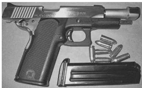
Пистолет Bul M5 Government в момент перезарядки

Пистолет QSZ-92 поступает на вооружение некоторых частей НОАК с середины 1990-х гг. Он выпускается под патрон 9×19 мм, по размерам идентичный патрону 9×19 мм «Парабеллум», а также под 5,8-мм патрон китайской разработки с бутылочной гильзой и остроконечной пулей (подобный бельгийскому патрону SS190). Автоматика пистолета основана на использовании энергии отдачи при коротком ходе ствола. Запирание затвора осуществляется поворотом ствола. Рамка пистолета выполнена из ударопрочного пластика. Ударно-спусковой механизм курковый, двойного действия. Двусторонний рычаг предохранителя расположен