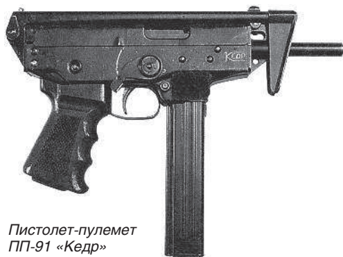
Пистолет-пулемет ПП-91 «Кедр»

Модификация ПП-91, приспособленная для стрельбы как патронами ПМ, так и высокоимпульсными патронами 9×18 ПММ, получила название «Клин». Пистолет-пулемет «Клин-2», появившийся в 1996 г., представляет собой модернизированный ПП «Клин» с приемником магазина, перемещенным в пистолетную рукоятку. Пистолеты-пулеметы «Кедр» пользуются большой популярностью в структурах МВД России.