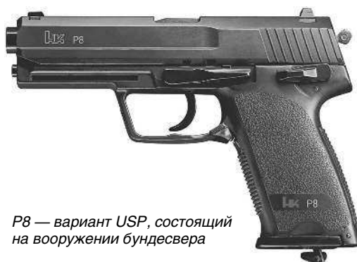
P8 — вариант USP, состоящий на вооружении бундесвера

Автоматика пистолета работает за счет отдачи при его коротком ходе. Ударно-спусковой механизм (УСМ) куркового типа с полускрытым курком. Автоматический предохранитель блокирует ударник до тех пор, пока не будет полностью выжат спусковой крючок. Модификация пистолета USP под патрон 9×19мм НАТО принята на вооружение бундесвера под обозначением P8. Она оснащается УСМ двойного действия с одним рычагом, включающим предохранитель и одновременно снимающим курок с боевого взвода.