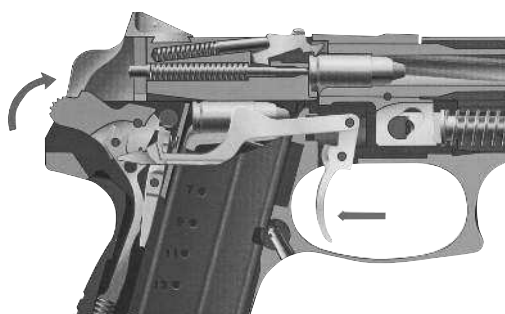
Положение частей пистолета «Грач» перед выстрелом

лет (получивший наименование МР-443 «Грач») стал победителем конкурса. В 2003 г. под наименованием «9-мм пистолет Ярыгина» (ПЯ) он был принят на вооружение Российской армии. В 2008 г. МВД России также объявило о переходе с пистолета Макарова на пистолет Ярыгина в качестве штатного оружия.