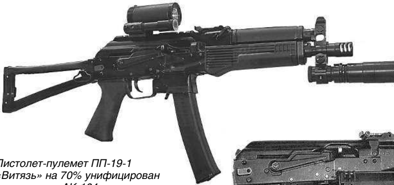
Пистолет-пулемет ПП-19-1 «Витязь» на 70% унифицирован с автоматом АК-104