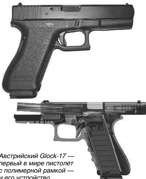
Австрийский Glock-17 — первый в мире пистолет с полимерной рамкой — и его устройство

В настоящее время пистолеты составляют основную массу личного оружия, используемого в армии. Их бесспорными до-