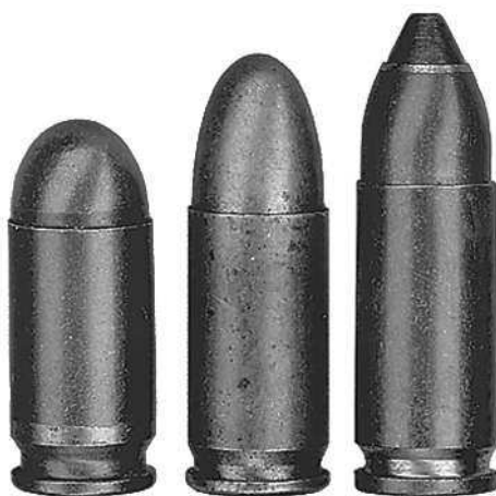
Сравнительные размеры патронов (слева направо): 9×18 ПМ, 9×19 Par и 9×26 РГ05

виши на рукоятке (выключается при полном охвате рукоятки ладонью), второй представляет собой рычажок на спусковом крючке и выключается, когда палец стрелка вжимает его в спусковой крючок. Так обеспечивается безопасность обращения с оружием при его постоянной готовности к выстрелу. «Гюрза» имеет обтекаемые формы и современный дизайн рамки из армированного пластика.