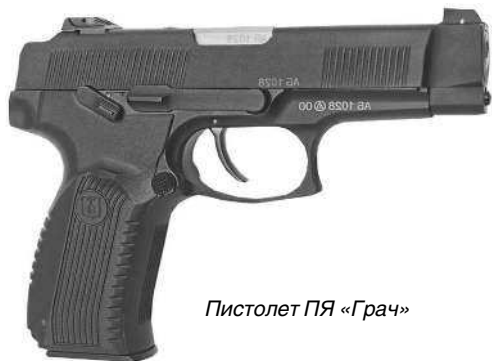
Пистолет ПЯ «Грач»

В 1990 году Министерство обороны объявило конкурс на новый армейский пистолет, призванный заменить не вполне отвечающий современным требованиям пистолет ПМ. В 1993 г. на этот конкурс был представлен пистолет конструкции Ярыгина. По результатам испытаний в 2000 г. писто-