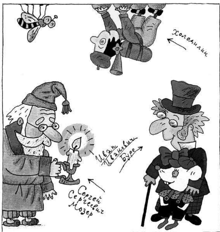
Рисунки В. Дмитриюка .....