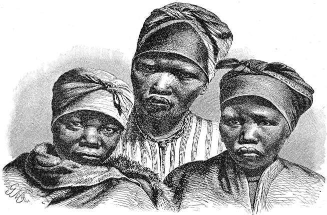
Готтентотки племени номаков

лицо, проводя красной краской круги вокруг глаз и дугообразные линии на лбу и щеках. Только одну свою старинную обувь готтентоты сохранили и до сих пор, они носят сандалии из коры или кожи, в таких сандалиях нога не тонет в сыпучем песке.