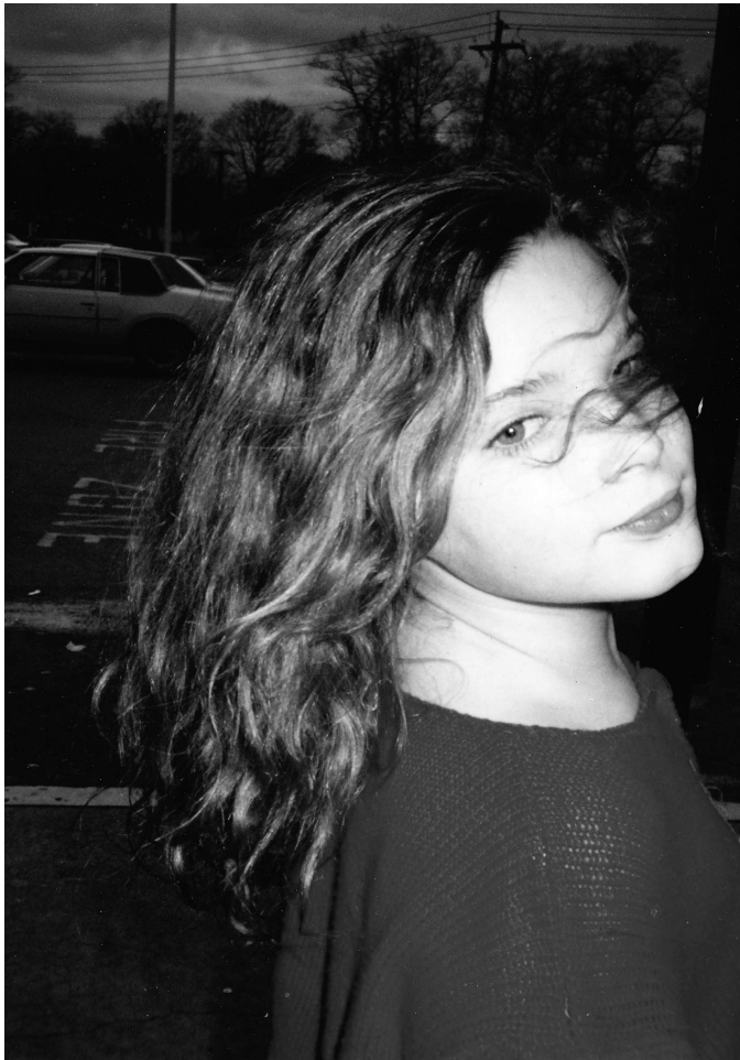
Ким в девять лет. С разрешения семьи Миллер