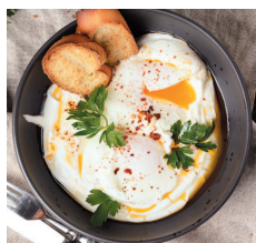
Турецкий завтрак ..... 21