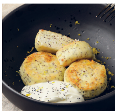
Лимонные сырники с маком .....90