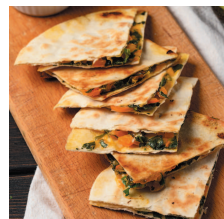
Кесадилья ..... 117