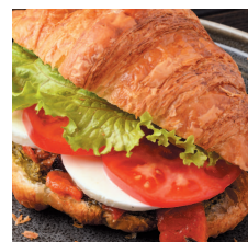
Круассан с печеным перцем, соусом песто и моцареллой.....53