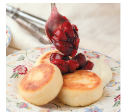
Кокосовые сырники с рикоттой..... 89