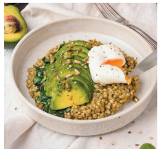
Зеленая гречка с соусом песто...30