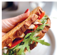
Сэндвич с курицей и соусом тартар ..... 61