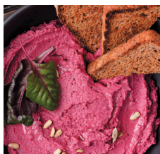
Свекольный хумус..... 121