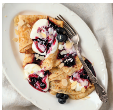
Безглютеновые блины ..... 81