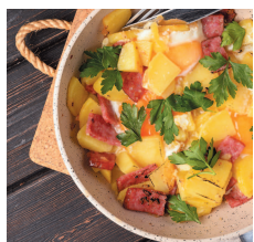
Яичница с колбасой и картофелем.....22