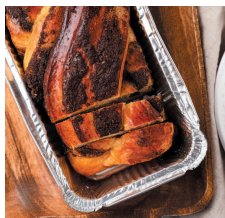
Бриошь-плетенка с корицей .....105