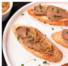
Паштет из куриной печени с луковым мармеладом .....55