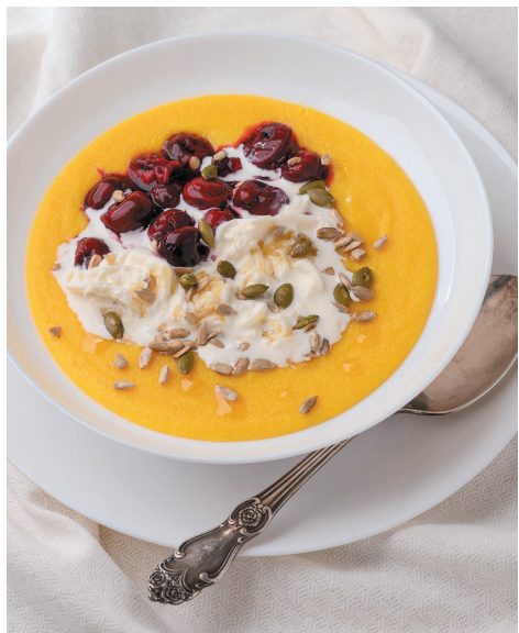
Кукурузная каша со страчателлой..... 29