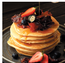
Панкейки с беконом и кленовым сиропом ..... 82