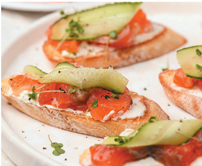
Брускетта с творожным сыром и слабосоленым лососем....49