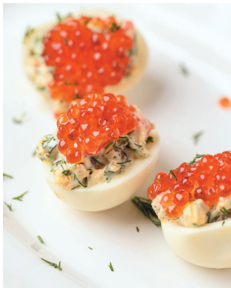
Яйца с лососем .....26