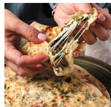
Лепешки с сыром и зеленью..... 85