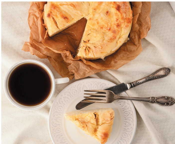
Баница ..... 110