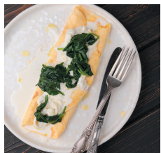
Омлет с трюфельной страчателлой .....18