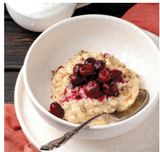
Рисовая каша с халвой ..... 33