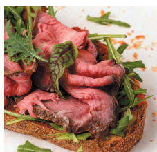
Брускетта с ростбифом ..... 45