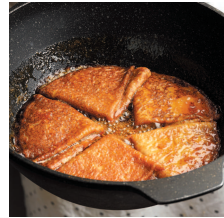
Блинчики «Креп Сюзетт».....73