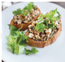
Брускетта с печенью трески ..... 42