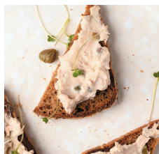
Рийет из консервированного тунца..... 62