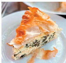
Пирог с брынзой и шпинатом ..... 113