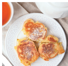
Оладьи дрожжевые с яблоками..... 66