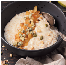
Овсянка с карамелизованной грушей и сыром дорблю..... 34