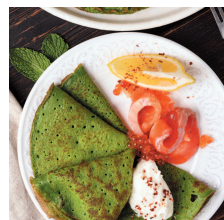
Зеленые блины из шпината .....77