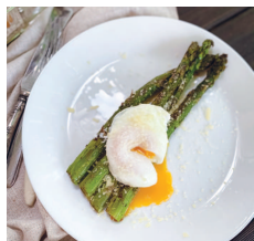
Спаржа с яйцом пашот .....14