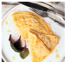
Омлет с хумусом..... 17