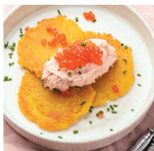
Драники с рийетом из лосося..... 65