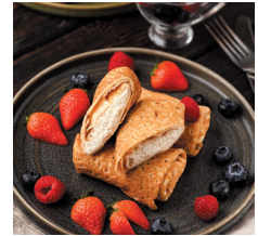
Блины с творогом .....74