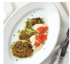
Кабачковые оладьи с икорным соусом ..... 78