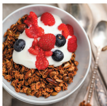
Йогурт с гранолой.....41