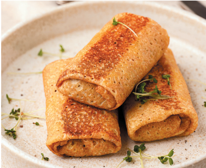
Блинчики с курицей и луком-пореем ..... 70