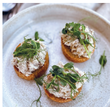
Паштет из запеченной скумбрии..... 58