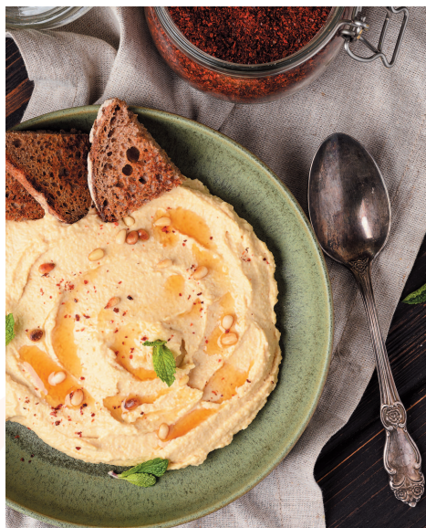
Хумус ..... 118