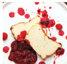
Творожная запеканка..... 94