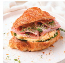
Круассан со скрэмблом и мортаделлой...50