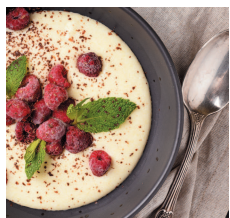
Манная каша с белым шоколадом.....37