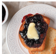
Домашний тостовый хлеб ..... 114