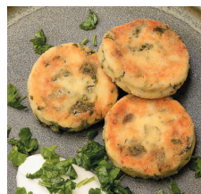
Сырники с сыром..... 93