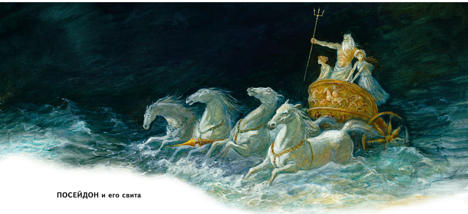
ПОСЕЙДОН и его свита

Посейдон — бог морей, у римлян — Нептун.