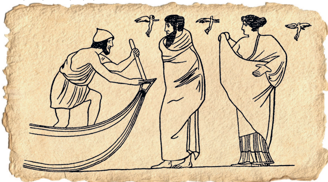
Харон перевозит души умерших

Глубоко под землёю царит Аид, брат Зевса, повелитель царства мёртвых. С поверхности земли ведут в это царство бездонные пропасти. По царству протекают подземные реки, главная из которых Стикс. По реке Ахеронт переправляет в царство Аида души умерших старец Харон. Но везёт он их только в одном направлении, и никому не удаётся вернуться обратно. У трона Аида — мрачный бог смерти Танат. Юный бог сна Гипнос вылетает из царства на землю и носится на своих крыльях с головками мака в руках — маковым молочком он смыкает веки смертных и погружает их в сладкий сон. Однако сон может стать смертельным, если Гипнос прольет молока больше, чем нужно. Здесь же боги и богини сновидений — и тяжёлых, мучительных, и лёгких, радостных или вещих, т. е. сбывающихся (по имени этого бога погружение в сон названо гипнозом). Стержёт вход в царство мёртвых ужасный пёс Кербер (Цербер). Под царством Аида находится мрачная бездна Тартар.