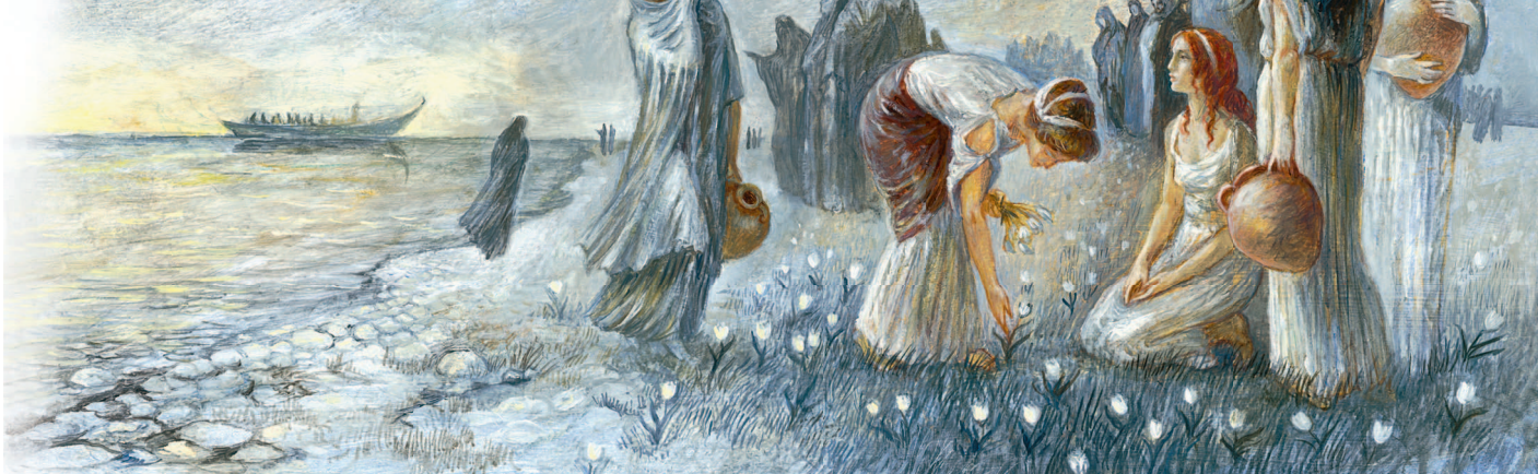
В ЦАРСТВЕ АИДА