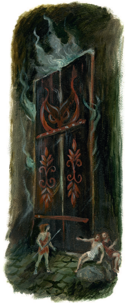
Двери в царство Аида

Великая Деметра вернула плодородие земле, и снова всё зацвело и зазеленело. Но каждый год покидает свою мать Персефона, и каждый раз Деметра погружается в печаль. И вся природа горюет по ушедшей, наступает зима. Спит природа, чтобы проснуться в радостном блеске весны тогда, когда вернётся к своей матери из безрадостного царства Аида её дочь. Тогда богиня плодородия щедрой рукой сыплет дары людям и благословляет труд земледельцев богатым урожаем.