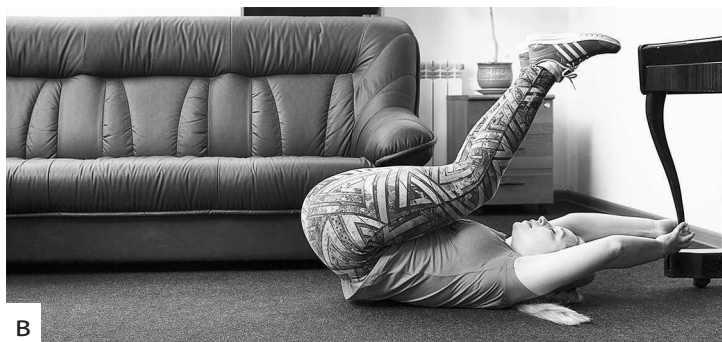
Фото б а, б, в