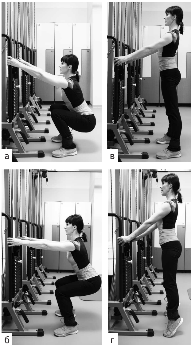
Фото 4 а, б, в, г