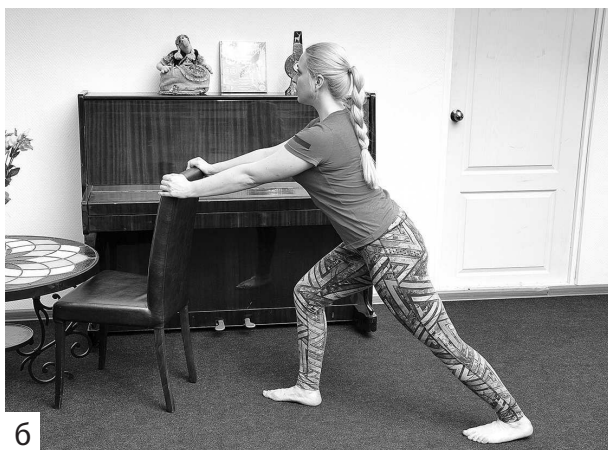
Фото 5 а, б