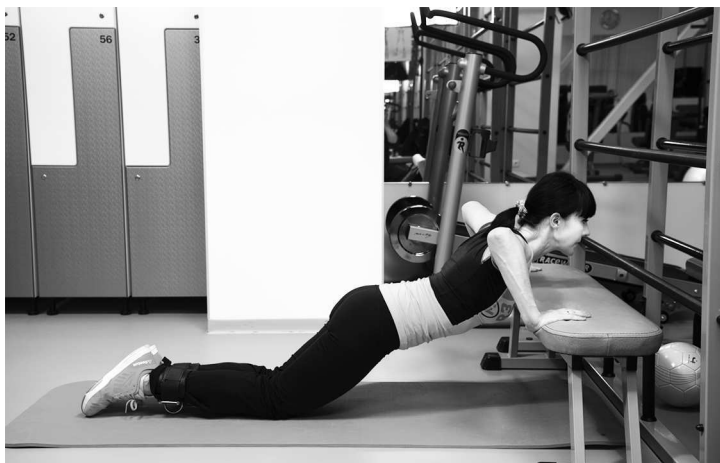
Фото 3 а

На первый взгляд этот тест прост: нужно отжаться от низкой скамьи, стоя на коленях. Тело абсолютно прямое, выполнить 10 повторений. Существенный нюанс: при каждом отжимании грудь должна касаться скамьи, руки при этом должны быть согнуты в локтевых суставах под острым углом, подбородок максимально поднят, голова смотрит вперёд, фото 3 (а, б).