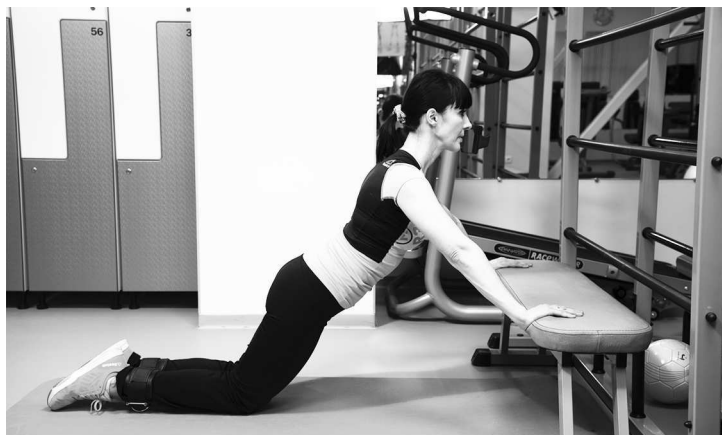
Фото 3 б