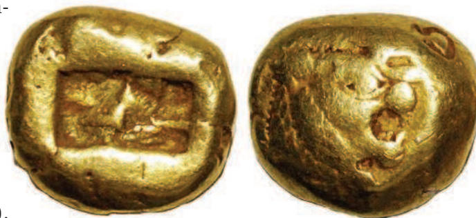
Рис. 1.5. Древние лидийские монеты — статеры

Затем чеканку денег освоили на греческом острове Эгина, и вскоре монеты стали изготавливать по всему Средиземноморью. Куски металла, выступавшие в качестве платежного средства в древнейших государствах мира — Вавилонии и Египте, конечно, нельзя считать монетами в полном смысле этого слова. Это был так называемый металлический стандарт: покупательная способность определялась весом металла. Термин «монета» относится прежде всего к законному платежному средству стандартной формы и веса, имеющему особые изображения, определяющие достоинство.