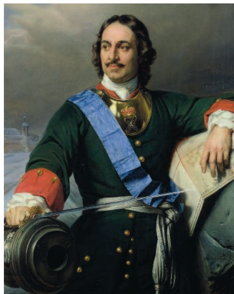
Рис. 1.8. Поль Деларош. Портрет Петра Великого. 1838 год. Кунстхалле, Гамбург

...Серьезный удар по монетной системе России был нанесен в 1769 году, когда в обращение впервые были введены бумажные