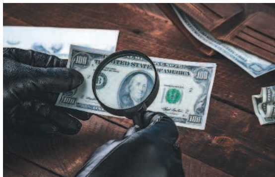
Рис. 1.9. Коллекции фальшивых платежных средств — от древности до наших дней, которые собирают отдельные музеи и частные собиратели, могут быть очень интересны

деньги — ассигнации. А с самими монетами чего только не случалось: в них уменьшали содержание драгоценных металлов, их чеканили из иностранных денег, а другие страны, бывало, изготавливали фальшивые рубли, чтобы подорвать экономику России. Кстати, некоторые коллекционеры собирают исключительно фальшивые деньги, изготовленные в разных странах (рис. 1.9)!