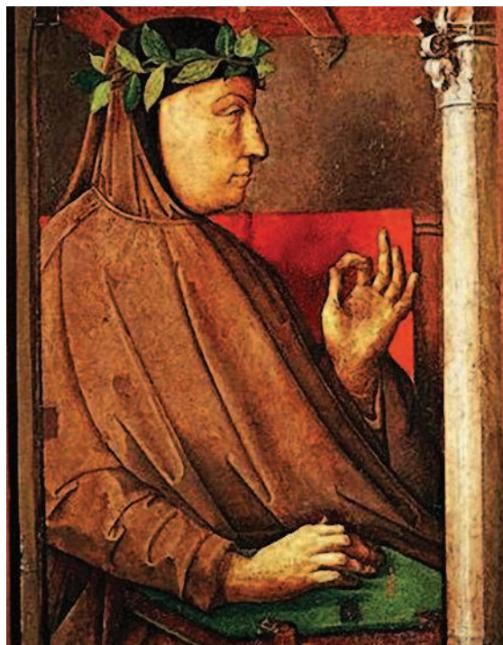
Рис. 1.14. Йос ван Гент. Портрет Франческо Петрарки. XV век. Национальная галерея Марке

В числе первых известных нам коллекционеров, целенаправленно