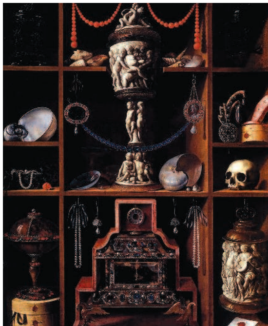
Рис. 1.16. Георг Хайнц. Кабинет коллекционера. 1664 год. Национальный музей Брукентала

частью собрания различных «редкостей» и «курьезов», которыми любила развлекать себя аристократия (рис. 1.16).