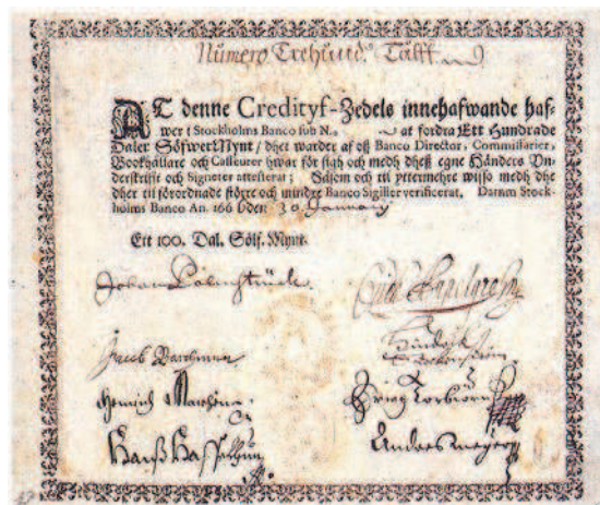
Рис. 1.10. Одна из первых шведских бумажных банкнот, практически полностью оформленных вручную

Считается, что Швеция первой в Европе начала изготавливать бумажные платежные средства. В 1661 году банк Стокгольма выпустил первые шведские банкноты. Правда, просуществовали они недолго: через несколько месяцев из-за слабого контроля за выпуском бумажных денег они начали обесцениваться. И вскоре бумажные деньги в Швеции практически исчезли, правда, в 1668 году попытка внедрить в обращение бумажные платежные средства была предпринята вновь.