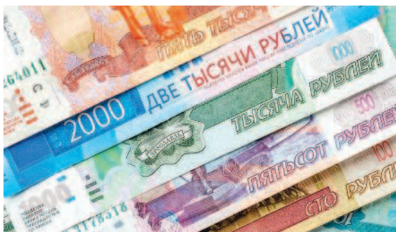
Рис. 1.12. Современные фиатные деньги

Кредитные деньги — это оформленное (обычно в виде ценной бумаги) право распоряжаться некоторой суммой средств с обязательством в дальнейшем возместить ее. Самый распространенный вид таких денег — векселя и чеки.