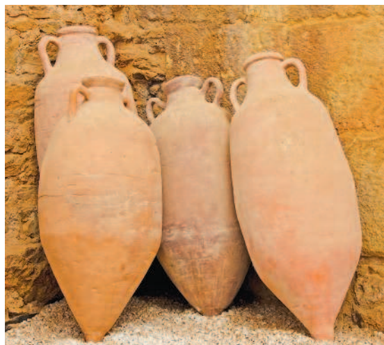
Рис. 1.4. Стандартные римские амфоры, вмещавшие около 26 литров воды (что соответствовало примерно 1 таланту)

Есть много любопытных историй о происхождении некоторых терминов, связанных с нумизматикой. Так, древние греки в качестве денег одно время использовали граненые металлические палочки, которые в количестве шести штук составляли одну драхму, в переводе — горсть (видимо, именно шесть палочек удобнее всего ложились в руку). Монета с названием «драхма» существовала в Греции вплоть до перехода на евро.