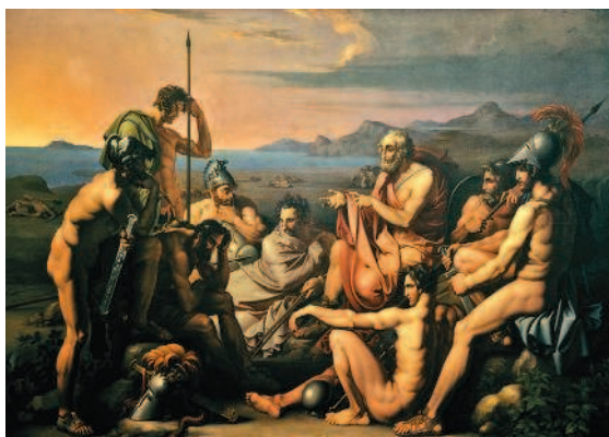
Рис. 1.2. В глубокой древности металлы были весьма дороги. Так, в гомеровских сказаниях в качестве награды самым могучим воинам выступают куски железа (Иоганн Тишбейн. Гомер. Ок. 1800 года. Августеум, Зальцбург)

С развитием городов значение скота как средства обмена понемногу снижалось, в первую очередь из-за неудобства расчетов. В то же время с расширением заморской торговли росла потребность в стандартных деньгах. Металл был избран как наиболее долговечный и дорогой материал. Интересно, что металлические предметы (например, ножи или наконечники стрел) изначально тоже служили средством платежа (рис. 1.2). До того как начали чеканить собственно монеты, то есть слитки определенной формы, веса, пробы