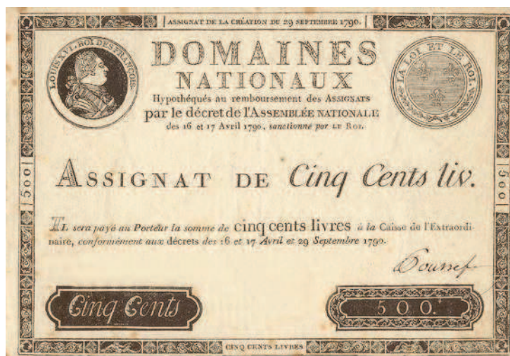
Рис. 1.11. «Ассигнат» времен Великой Французской революции, имевший силу законного платежного средства и официально обеспеченный государственным имуществом

можете заменять монеты, драгоценные камни, недвижимость или любое другое имущество, как бы «передавая» эквивалент стоимости этого имущества любым заинтересованным лицам. В Европе и Америке первые подобные платежные средства начали внедрять в XVII–XVIII столетиях (рис. 1.10, 1.11). В России они впервые были изготовлены в годы правления Екатерины II.