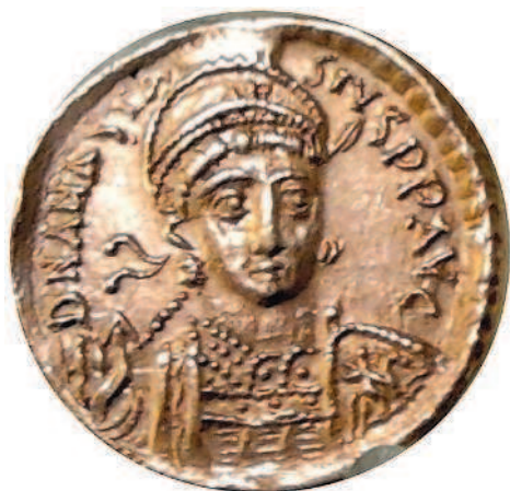
Рис. 1.13. Византийская монета с изображением императора Анастасия I (вероятнее всего, именно в годы его правления в Византии появились нуммии)

В VI столетии в Византии существовала мелкая медная монета со сходным названием — нуммий (нуммиум), причем там иногда название «нуммий» применялось к деньгам в целом (рис. 1.13). Однако во времена Античности и раннего Средневековья термина «нумизматика» еще не было. Когда точно он появился — единой точки зрения нет. Однозначно можно сказать, что в эпоху Возрождения он уже