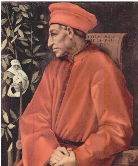
Рис. 1.15. Якопо Каруччи (Понтормо). Портрет Козимо Медичи Старшего. Ок. 1518 года, галерея Уффици

Так как Ренессанс — это прежде всего возрождение интереса к культуре и ценностям Античности, то и коллекции того времени основывались главным образом на монетах Древней Греции и Рима. Но коллекционеров еще не называли нумизматами. Собиратели старины и предметов искусства были известны в основном под названием антиквариетов. Среди них преобладали представители высшего сословия, имевшие не только хорошие финансовые возможности, но и высокий уровень образования. В большинстве случаев коллекции монет являлись лишь небольшой