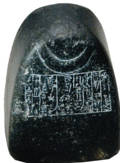
Рис. 1.3. Шумерский эталон веса — ½ мины (мина равнялась 1/6 таланта). Материал — диорит, магматическая горная порода. Ок. 2000 года до н. э. Лувр

и достоинства, взвешивали и отмеряли металл прямо на месте. С куском металла (обычно это было серебро) покупатель приходил на рынок, взяв с собой гири и все необходимое для того, чтобы отрубить кусочек слитка. Достоинство платежного средства определялось его весом.