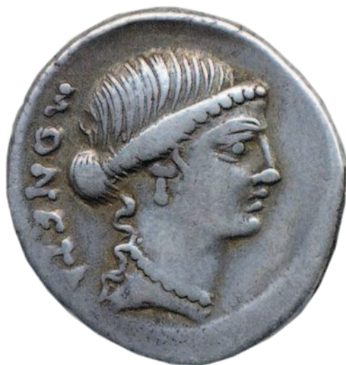
Рис. 1.6. Древнеримский денарий с изображением Юноны-Монеты

В литературе встречаются также указания на то, что первые монеты были изготовлены в Китае еще в XI веке до нашей эры, но они не чеканились, а отливались в специальных довольно примитивных формах; так что скорее они были ближе к простым металлическим брускам и колечкам, наподобие вавилонских и египетских, нежели к монетам как таковым. Само же слово «монета» (moneta) родилось в Древнем Риме. «Монетой», то есть «советчицей», «предостерегающей», называли богиню Юнону, изображение которой украшало древнеримские деньги (рис. 1.6).