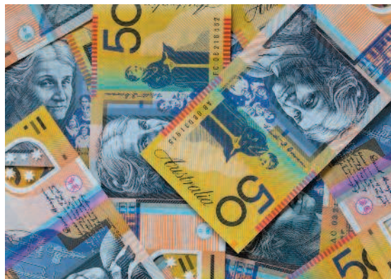
Рис. 1.1. Банкноты австралийского доллара изготавливаются из специального тонкого пластика со второй половины 1980-х годов

по-разному, а где-то и вовсе не начинался. Даже в наши дни хозяйствование некоторых племен строится на натуральном обмене. Какие именно предметы играли роль денег в древних обществах, часто зависело от природных условий: это могли быть плоды, ракушки или другие местные ценности. Нередко средством обмена служил скот. В разное время средством платежа могли выступать шкурки пушного зверя (Древняя Русь), бруски соли (Африка), какао-бобы (Мексика). В Монголии и Китае роль денег порой исполнял пресованный плиточный чай.