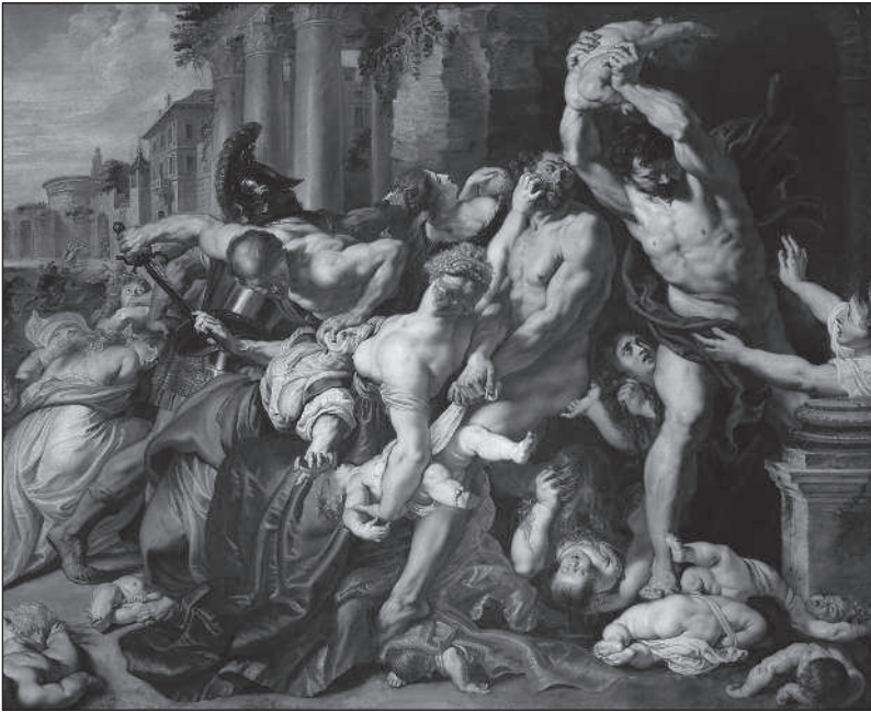
Избиение младенцев. Питер Пауль Рубенс. 1609–1610 гг.

хорошо это или дурно. Не спрашивают себя, хватит ли им духу вырвать плачущего ребенка из рук матери и совершить над ним казнь. Когда придет время, они выполнят приказ и сделают то, что должны сделать, — иначе сами будут казнены на месте за неповиновение.