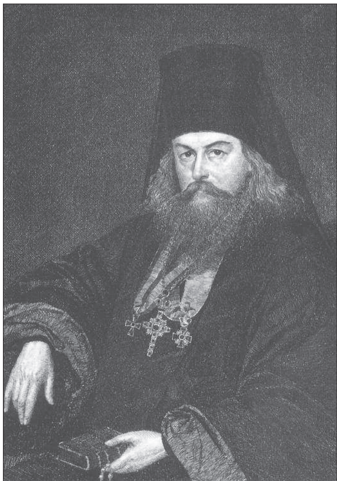
Святитель Игнатий (Брянчанинов). Гравюра Л. Е. Дмитриева-Кавказского. 1882 г. Российская Государственная Библиотека