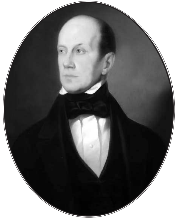
Петр Яковлевич Чаадаев (1794—1856)

Что, кажется, значат два-три листа, помещенных в ежемесячном обозрении? А между тем, такова сила речи сказанной, такова мощь слова в стране мечтаний, непривыкшей к свободному говору, что письмо Чаадаева потрясло всю