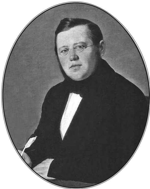
Михаил Николаевич Загоскин (1789—1852)

знал один офранцузенный граф Ростопчин 1 , да и тот частенько перевирал его, преобразовывая в «балаганный стиль».