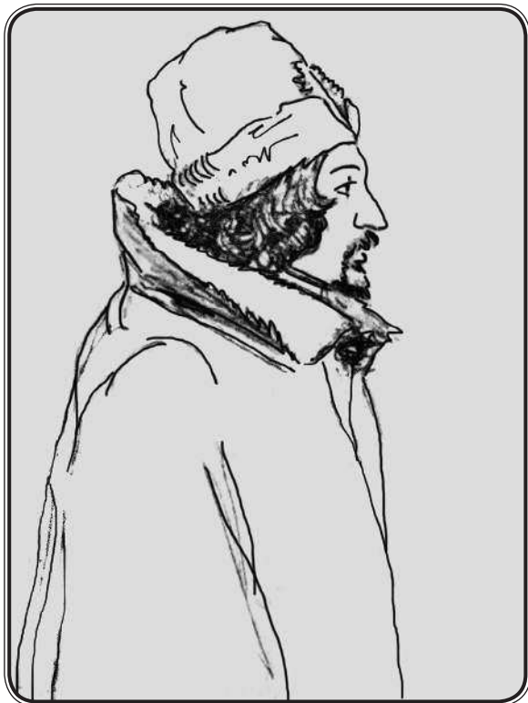
Э. А. Дмитриев-Мамонтов. А. С. Хомяков в мурмолке. Карандашный набросок. 1850-е гг.

Разумеется, такой голос должен был вызвать против себя оппозицию, или он был бы совершенно прав, говоря, что «прошедшее России пусто, настоящее невыносимо, а будущего для нее вовсе нет», что «это пробел недоразумения, грозный урок, данный народам — до чего отчуждение и рабство могут довести». Это было покаяние и движение. Оно и не прошло так. На минуту все, даже сонные и забитые, воспрянули, испугавшись зловещего голоса. Все были изумлены, большинство было оскорблено, человек десять громко и горячо аплодировали автору.