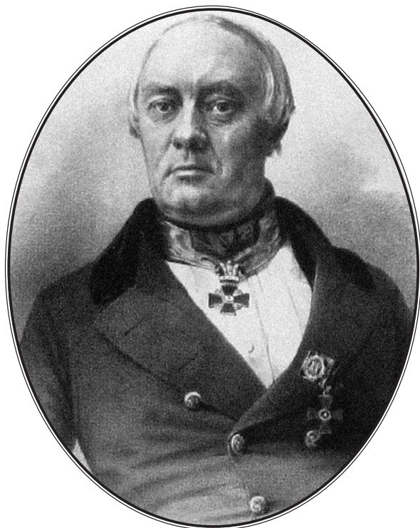
Степан Петрович Шевырев (1806—1864)