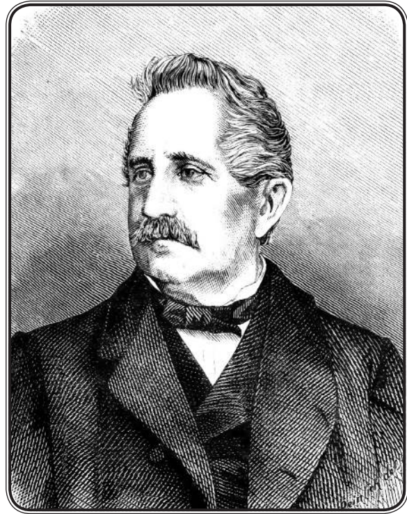
Людевит Гай (1809—1872)

«Так, например, в конце тридцатых годов был в Москве проездом панславист Гай 2 . Москвитяне верят вообще всем иностранцам; Гай был больше чем иностранец, он был „наш брат“ славянин. Ему, стало быть, нетрудно было разжалобить наших славян судьбой страждущих и православной братии в Далмации и Кроации; огромная подписка была сделана в несколько дней, и сверх того Гаю был дан обед во имя всех сербских и русняцких