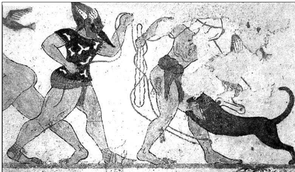
Рис. 1. Фреска с изображением боя человека с капюшоном на голове с собакой, натравливаемой на него человеком в маске. «Гробница Авгуров», Тарквиния, VI в. до н.э.

изображено убийство противника 1 . Это уже прямые параллели с римскими мунера . К сожалению, мы ничего не знаем о том, кем были эти люди — военнопленными или преступниками, специально ли их готовили к поединкам или отобрали в последний момент.