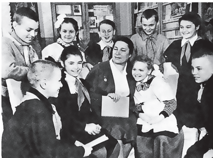
Среди читателей и помощников

Неустанно, годами, многие родители и дети ищут друг друга. И часто находят. Есть люди, которые в государственных организациях по призванию и по должности — прекрасная должность! — соединяют семьи, разлученные войной. Они отыскали и возвратили родителям тысячи и тысячи детей. И продолжают искать.