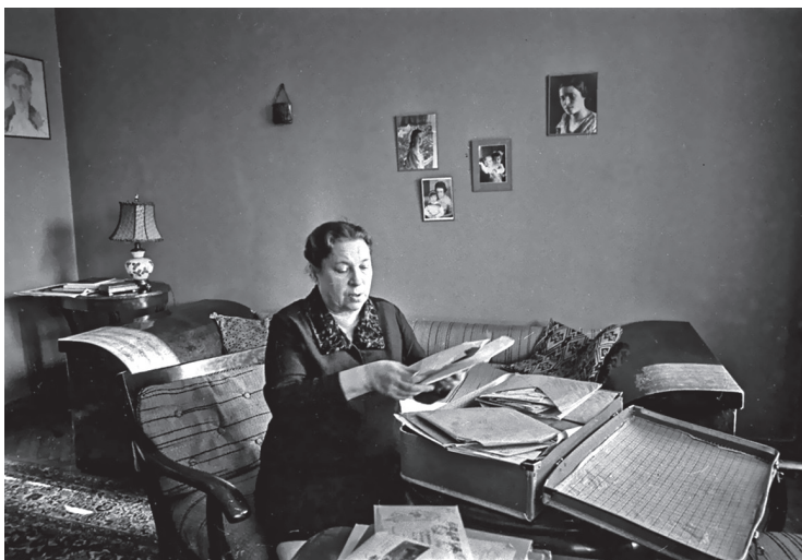
Агния Барто среди заветных писем

Опять гибнут дети, опять разрушаются семьи. А у нас матери еще не перестали оплакивать погибших в Великую Отечественную войну. И не перестали искать детей, потерянных во время фашистских налетов, пожаров, спешной эвакуации.