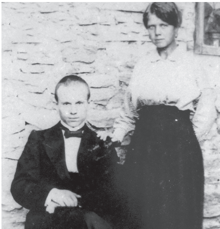
Слесарь с шахты Юзовка Никита Хрущев с женой

Вот пример семьи еще одного известного дореволюционного рабочего царской России — Никиты Сергеевича Хрущева. В воспоминаниях, изданных в постсоветское время, Н. С. Хрущев сообщал: «В том районе Донбасса, где я трудился (слесарем на шахте в Юзовке — м. Т.), до революции жили лучше, даже значительно лучше. Например, в 1913 году я лично был обеспечен материально лучше, чем в 1932 году, когда работал вторым секретарем Московского комитета партии» 17 .