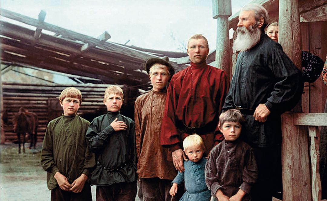
Крестьян- ская семья

По поголовью скота (в пересчете на крупный рогатый скот) Россия немного уступала США. Но опережала десять самых богатых стран Европы. И тоже — вместе взятых 9 . Равным образом и по многим другим показателям мы занимали лидирующие позиции в мировом сельском хозяйстве.