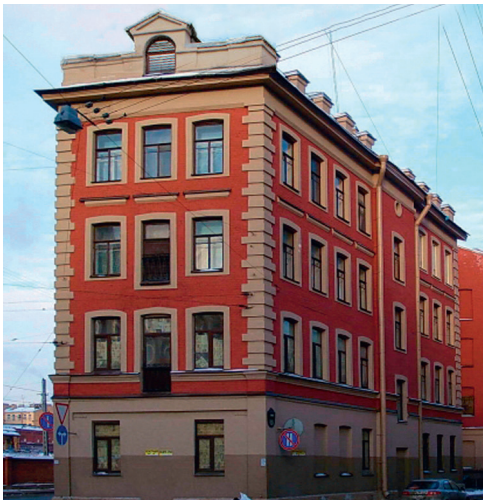
Дом, в котором жила семья Косыгина

съезде партии. В идеологическом отделе ЦК КПСС Косыгину подготовили тезисы. Из них Алексей Николаевич с изумлением узнал, что советский рабочий сегодня живет в восемь раз лучше, чем рабочий в Российской империи в 1913 году.