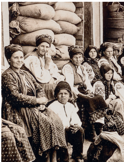
Крестьянская семья на празднике

в предреволюционной России говорят не только картины поразительного изобилия, отраженного в живописи, литературе и фотографии того времени. О профессионально проработанной сельскохозяйственной политике царского правительства в период Первой мировой войны, когда на фронт было мобилизовано пятнадцать миллионов человек, свидетельствует тот факт, что серьезных проблем с продовольствием в Империи не было. А ведь