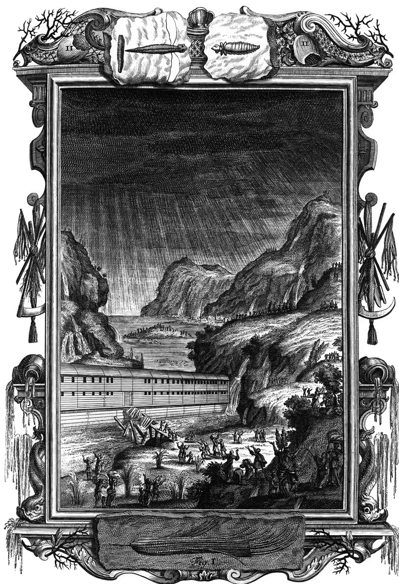
Рис. 11. Иллюстрация из трактата Иоганна Шейхера «Священная физика, или Естественная история Библии» ( Physique sacrée, ou Histoire naturelle de la Bible , 1732), на которой вместе со сценой Всемирного потопа представлены отпечатки «стрекозы» из Монте-Больки и стрекозиной личинки из Энингена.