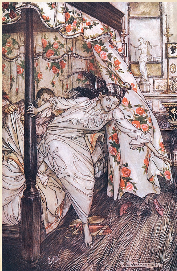
ЛАСКА И АФРОДИТА