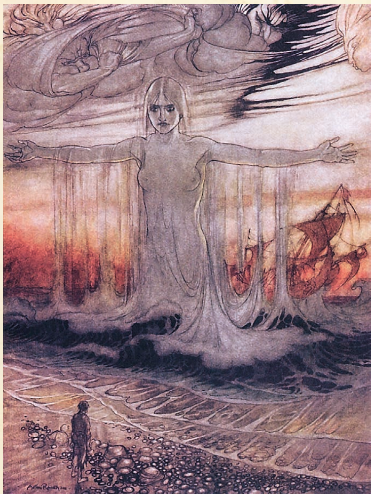
ЧЕЛОВЕК, ПОТЕРПЕВШИЙ КРУШЕНИЕ, И МОРЕ