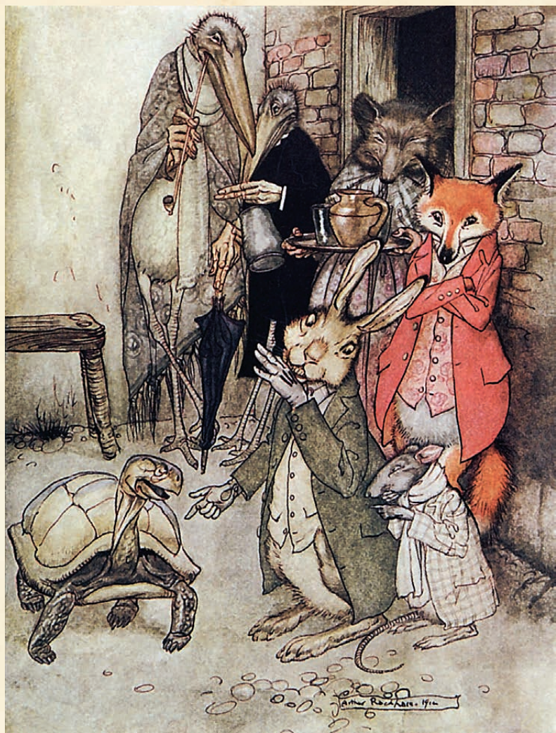
ЧЕРЕПАХА И ЗАЯЦ