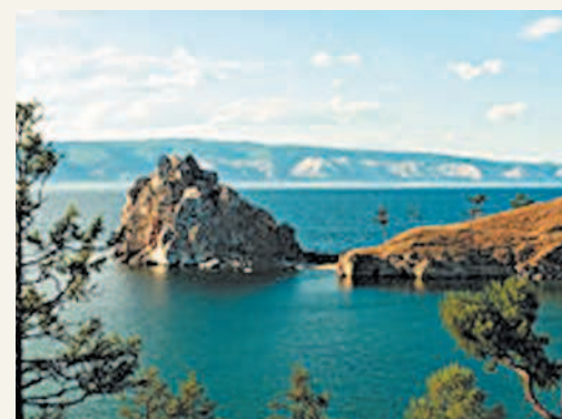
Байкал — природная жемчужина России

рии. В одном озере Байкал содержится около 19% мировых запасов пресной воды. Половина всех земель России занята лесами. Леса играют важную роль в газовом балансе атмосферы и регулировании планетарного климата Земли. В России находится пятая часть всех лесов мира и половина мировых хвойных лесов. Животный мир разнообразен. Количество видов животных на территории России достигает 125 тыс.