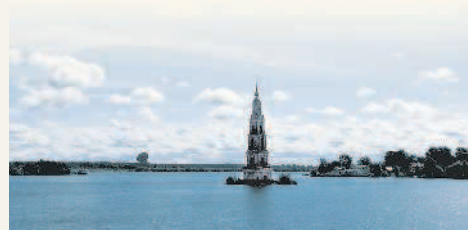
Волга в районе города Калезин