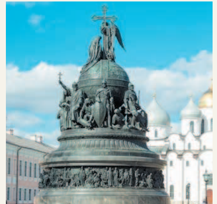
Памятник «Тысячелетие России» Великий Новгород. Кремль

В соответствии с Законом Российской Федерации «Об образовании Ингушской Республики в составе Российской Федерации от 4 июня 1992 г. для подготовки правовых и организационных мероприятий по государственно-территориальному разграничению у таювлен переходный период.