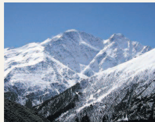
В горах Кавказа