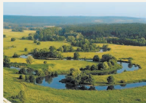
На Русской равнине