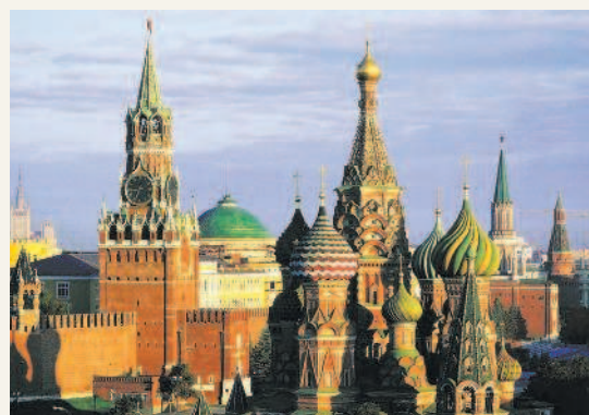
Москва — столица Российской Федерации