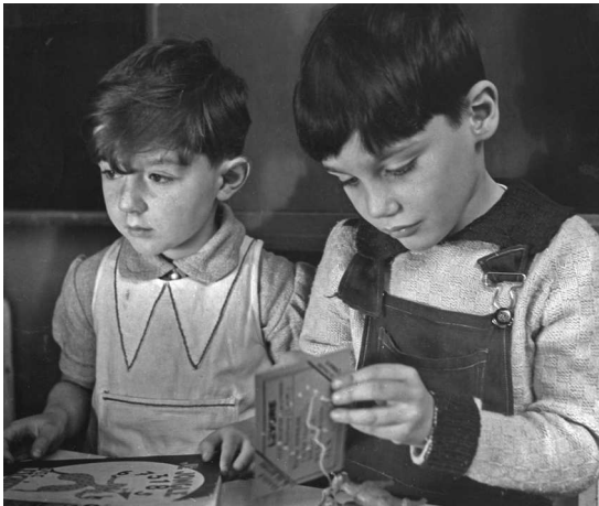
Мне 5 лет. Детский сад в Париже

— Что ж, попробую, — взял кораблик и стал возиться с веревкой. Я наблюдал за ним крайне внимательно, и почему-то сильное впечатление произвело на меня небольшое вздутие, которое я заметил на безымянном пальце его левой руки. Он легко справился с узлом, отчего я почувствовал себя неумехой, и отдал мне кораблик. Я поблагодарил его. А мама сказала: