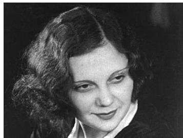
Моя мама еще до знакомства с моим папой. Париж