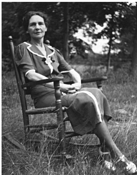
Бабушка незадолго до смерти

Дети, перебираясь из страны в страну, получали лишь поверхностное образование и в конце концов были размещены матерью в школы-интернаты. Моя мама попала в школу при католическом женском монастыре в городе Дамфризе в Шотландии. Завершив там учебу, она вернулась в Париж, где устроилась работать монтажером во французском филиале американской кинокомпании Paramount. Вскоре она встретила моего отца.