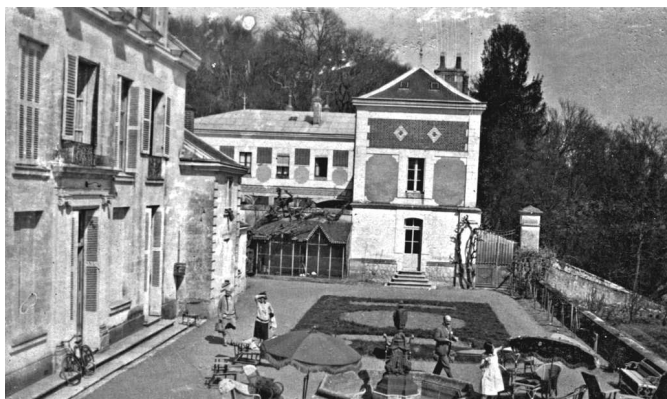
Шато, которое снимала моя бабушка, чтобы сдавать его богатым гостям