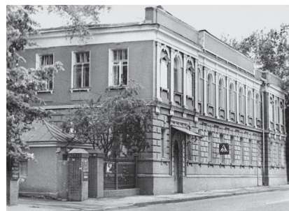
Бывший родильный дом, где появился на свет Владимир Высоцкий . Москва, ул. Щепкина, д. 61/2. 1980-е гг.