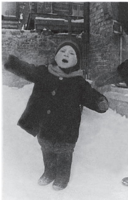
Володя Высоцкий во дворе дома на Первой Мещанской. Январь 1940 г.