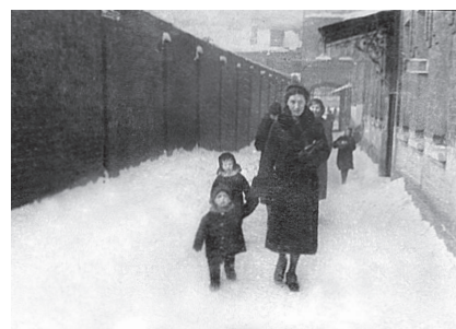
Дом № 126 на Первой Мещанской улице. Москва. 1930-е гг.